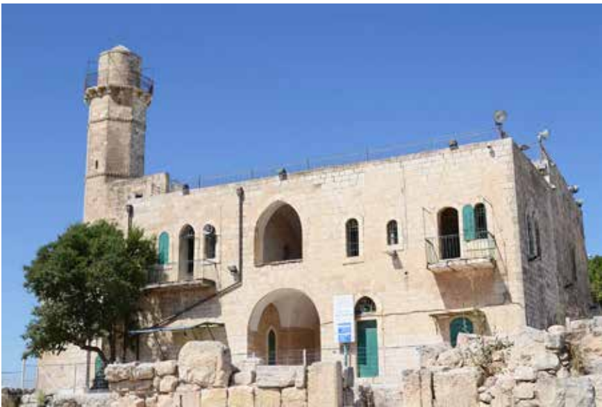
Sámuel próféta sírja kívülről

ókori Izraelben négy hatalmi ág létezett egymással párhuzamosan. A bíró vagy a király mellett a próféták, a papság és a jogalkotás, illetve a törvénykezés intézménye is jelen volt. E hatalmi ágak élesen elkülönültek egymástól. Természetesen az itt leírt modell egy ideális államról kíván képet adni, ami a Biblia tanúsága szerint nagyon rövid ideig működött így a gyakorlatban. A királyok, úgy tűnik, könnyen hajlottak arra, hogy gyorsan túl nagy hatalmat szerezzenek maguknak, és emiatt a rendszer egyensúlya is érthető módon hamar borult.