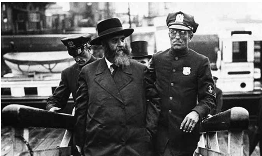
Josze Jichak Schneersohn, a 6. lubavicsi Rebbe megérkezik Amerikába

Látogatása alatt egy újságírónak a következő nyilatkozatot adta, melyet a Zsidó Ujság is lehozott: