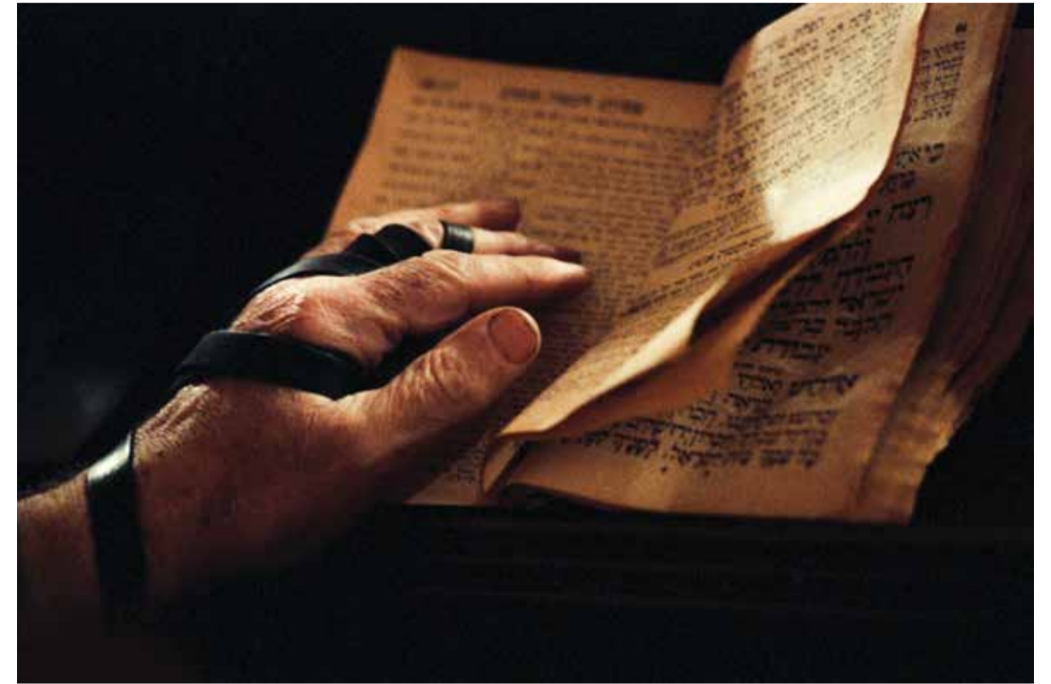
“Eljegyelek magamnak örökre...” A tflin a zsidó nép különleges micvája, mely látható összekötést jelent az Örökkévaló és a zsidó nép között. A karra és fejre erősített tflint, melyben tórai idézetek vannak, minden 13. életévét betöltött férfinak fel kell helyeznie hétköznap reggelenként a tflin parancsolata szerint.

Munkács város neve fogalomnak számít a világ zsidó közösségeiben. Munkács a 19. századtól kezdve egyre többet szerepelt a közép-kelet-európai zsidó levelezésekben, majd Spira Chájim Elázár rabbitól fogva gyakorlatilag megkerülhetetlenné vált a vallásos zsidó világban. Munkácsot a Kárpátalja, sőt Magyarország Jeruzsálemének nevezték, miután az öszlakosság bő harmada, egyidőben pedig majdnem a fele is zsidó származású volt. A Spira-dinasztia alatt kiépült a munkácsi haszid udvar, mely jelentős befolyással bírt nemcsak a helyi, de a környékbeli hitközségek életére is. 1944-ben a magyar zsidók közül a munkácsiakat elsőként deportálták Auschwitzba. A felszabadítás után, a koncentrációs és haláltáborok, a munkaszolgálat kisszámú túlélője megpróbálta újjáépíteni romjaiból a hitközséget, azonban a kommunizmus vallásellenessége sokakat a távozásra kényszerít. A túlélők legjava elhagyta ősei szülőföldjét, s a legtöbbben az Egyesült Államokban és Izraelben igyekeztek új életet kezdeni. De a „munkácsi diaszpóra” még ekkor sem szűnt meg, mert voltak és maradtak a városban olyan auschwitzi túlélők, akik még egy szibériai internálás után sem mentek el.