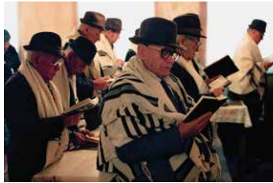
Kávóne – A káváná, vagyis askenáz kiejtéssel kávóne héberül tudatosságot jelent, melyet a hétköznapokban áhítatként fordítunk.