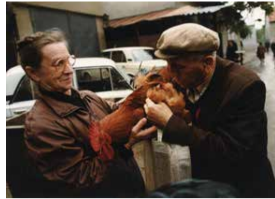
Kakasbörze – A munkácsi emberek szerint azért kell belefűjni az állat tollába, hogy látszódjon, mennyire sárga a bőre. Ha elég sárga, akkor az azt jelenti, hogy fiatal, tehát jó a húsa is. Viszont, ha sápadt, akkor az kiváló alkalapot jelent, hogy olcsóbban juthassanak a baromfihoz.