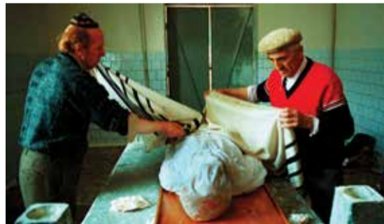
Táleszba burkolás – „Örvendve örvendek az Örökkévalóban, vigadjon lelkem Istenemben, mert az üdv ruhába öltöztetett engem, az igazság köpenyét adta rám, mint a vőlegény, ki papi fejdísz vesz magára, és mint a menyasszony, ki ékszereivel díszíti magát.” (Jesájá 61:10) – A férfiakat a táleszükben szokták eltemetni, úgy, hogy az imalepel egyik sarkán lévő ciceszt poszullá, azaz alkalmatlanná teszik, mivel a halott már nem fogja használni azt.