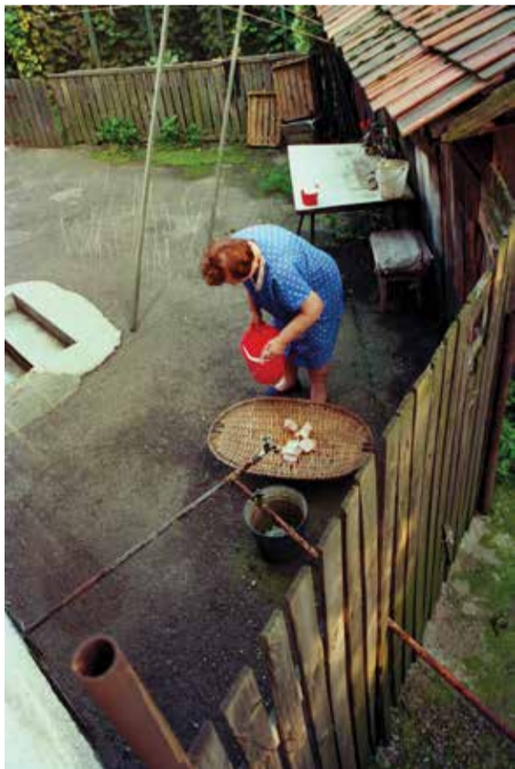
Rájnig – A kóser húst feldolgozás előtt be kell sózni, azaz rájningolni kell, hogy minden vért eltávolíthassanak belőle.