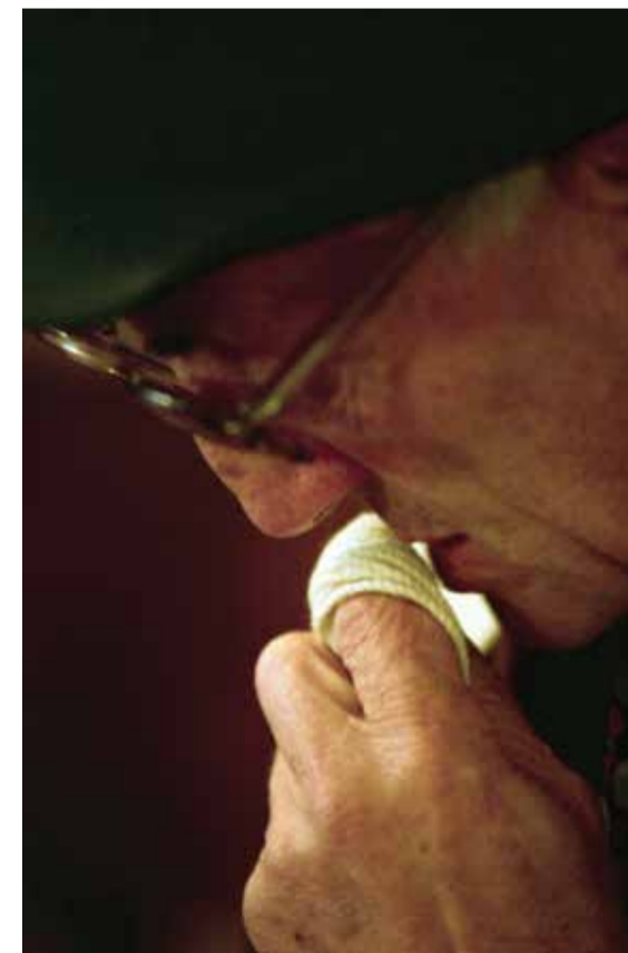
A tálesz négy sarkán imarajtok, vagyis ciceszek csüngnek, melyeket a reggeli ima alkalmával bizonyos szövegrészekkor a vallásos zsidó az ujjai köré csavargat, s azokra finom csókot lehel.