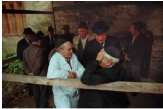
Kitliben az imák közötti szünetben – Az engesztelőnapon, vagyis jom kipurkor (illetve egyes helyeken ros hasánákor, illetve a peszáchi széderestekor a házigazdának) szokás a házas férfiaknak kitliben, egyszerű fehér, zseb nélküli ruhában imádkozni, mely segíti az elmélyülést az imában. A Talmudból (Sábát 119a.) ismerjük az alábbi történetet, amikor egyszer megkérdezték Ráv Hámnunát: mit is jelent a mondás: „Isten szentsége van megtisztelve”? Ráv Hámnuná úgy felelt, hogy utalás ez az engesztelőnapra, amikor tilos enni és inni, és a Tóra megköveteli a zsidóktól, hogy megtiszteljék azt. A szombatot és más ünnepnapokat is tiszta, ünnepi ruhával tisztelik meg a zsidók, a kommentátorok pedig hozzátézik, hogy miután jom kipur az év legszentebb napja, ezért azt egyedi ruhával illik megtisztelni. Egyes magyarázatok szerint az egyedi ruha nem más, mint a kitli. A kitli fehér színét a zsidó Bölcsék többek között az alábbi idézetből vezetik le: „Ha vétkeitek olyanok volnának, mint a bíbor, megfehérülnek, mint a hó; ha vörösek volnának, mint a karmazsin, olyanok lesznek, mint a gypjű.” (Jesájá 1:18)