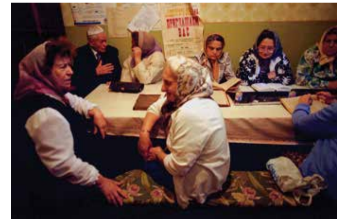
Asszonyok – A vallásos, orthodox zsidóknál a nők és a férfiak hagyományosan el vannak különítve az imádkozás idején. Nagyobb zsinagógákban a nők jellemzően karzaton foglalnak helyet, míg a munkácsi stiebelben, egy külön szobában imádkoztak. A női szobában mindenkinek be volt kötve a feje, hiszen asszonyok voltak, akiknek a tórai hagyományoknak megfelelően a házasságot követően el kell fedniük a hajukat.