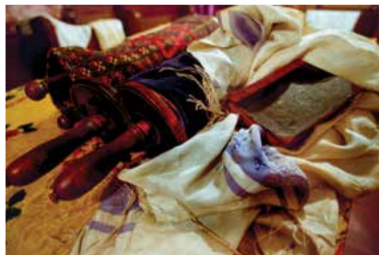
Anyagok találkozása és törése – Egy héten háromszor, hétfőn, csütörtökön és szombaton olvasnak fel a Tóra-tekercsből. A Tórárt, vagyis Mózes öt könyvét egy hozzáértő szófer kézzel írja egy kóser állat bőréből készült pergamenre, mely két rúdra, úgynevezett éc chájimra van felerősítve. Felolvasások közben összetekerve, egy díszesebb köntösben tárolnak.