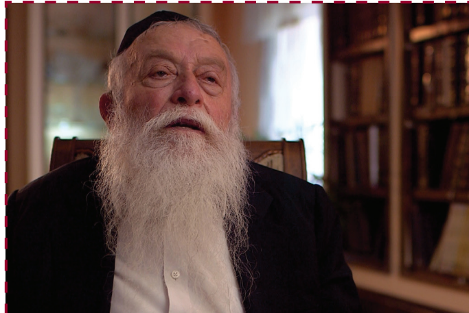
Moshe Naparstek rabbi (1935–2016) a Kfár Chábádban működő Tomcháj Tmimim jesiva tanára volt több mint ötven éven keresztül. Az interjú 2014 márciusában készült.

magamban. Talán mégis a többi tanárnak van igaza, és szigorúbban kellene velük bánni. Úgy döntöttem, hogy a Rebbéhez fordulok tanácsért.