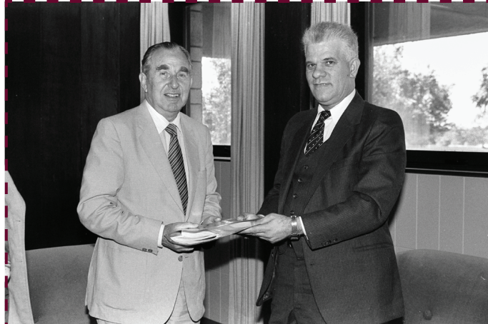
Mose Mandelbaum professzor az Izraeli Nemzeti Bank elnöke volt a nyolcvanas években, és sokat tett az izraeli gazdaság megszilárdításáért. A Bár-Ilán Egyetemen, a Netánjái Főiskolán és az Askeloni Főiskolán oktatott közgazdaságtant. Az interjú 2016 márciusában készült Jeruzsálemben.

volt, hogy ha a professzor meg is jelenik a védésem, elmarasztaló véleményt fogalmaz meg, és így nem ítélik meg a doktori fokozatot, tehát az egész addigi munkám kárba vész.