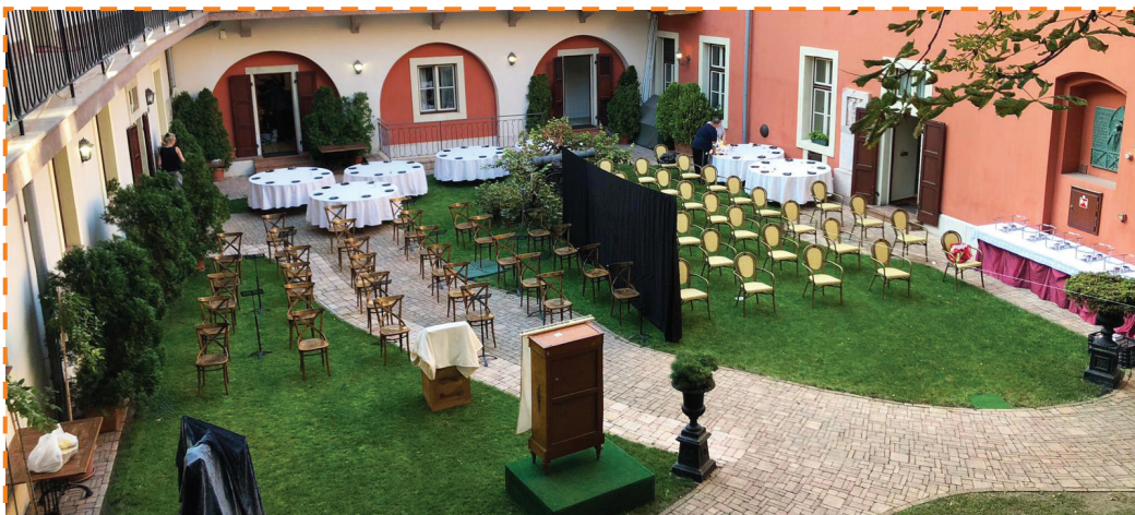
Gyönyörű környezetben köszöntötte az újévet a vári zsinagóga közössége

A Mázkir szövege megtalálható a Sámuel imája – Zsidó imakönyvben 349. oldalon és az 5781-es Zsidó naptárban.