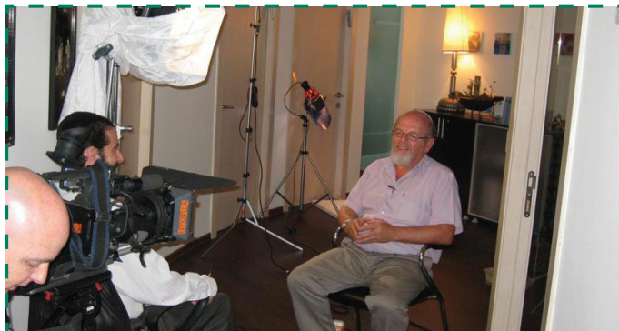
Alan Baker nemzetközi jogász és Izrael egykori kanadai nagykövete. Az interjú 2010 júliusában készült.

(Eredetileg, a libanoni háború kitörésekor, a Rebbe azt javasolta, hogy gyorsan semmisítsék meg a terroristákat, majd vonuljanak vissza, de a találkozó idején, 1984-ben ez már nem lett volna tanácsos.)