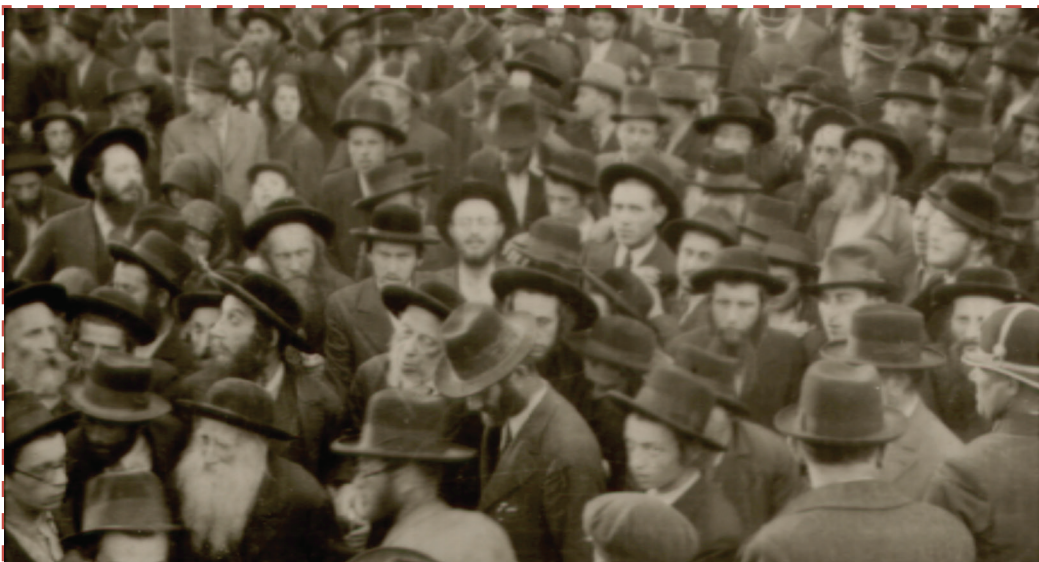
Spira Chájim Elázár rabbi temetése