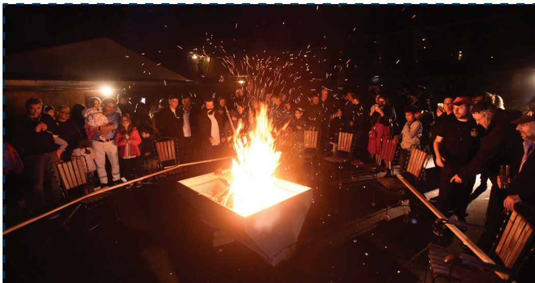
Lág báomeri ünnepe 2019-ben, Budapesten

A Dohány utcai Kóser Piac továbbra is a rendes nyitvatartási időben várja vásárlóit.