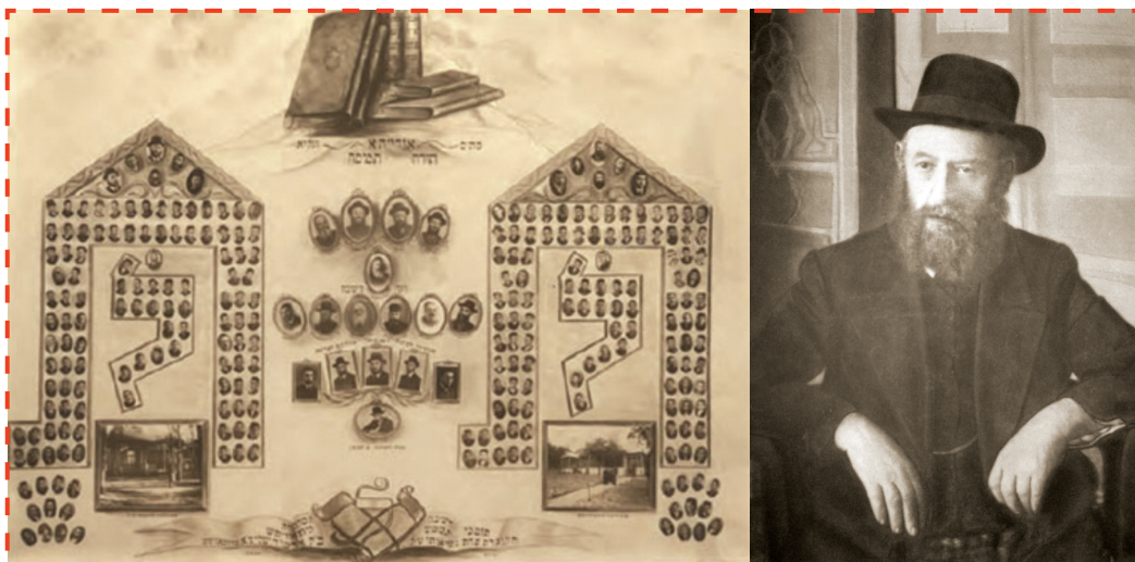
Sálom Dovber Schneersohn rabbi és az általa alapított Tomchei Temimim iskola varsói tablója

A Dohány utcai Kóser Piac továbbra is a rendes nyitvatartási időben várja vásárlóit.