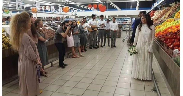
Esküvő egy szupermarketben, ahol legalísan jöhetett össze száz vendég a kellő távolság megtartásával

tani az esküvőt (RSZ: Igrót kodes 123. fejezet).” Ez ugyanis olyan, mintha az ember sorban állna, de elhagyná a helyét, kockáztatva, hogy esetleg elveszti az az esélyét arra, hogy sorra kerüljön. A Zohár szerint (3:219b–220a.) a pár ősei jelen vannak a hüpenél és megáldják őket, amiről azt mondja Chánoch Henich rabbi (1800–1884), az olesko Rebbe (idézi Nité Gávriél uo.): a kitűzött időpontot ők eljárnak, és ha nincs esküvő, akkor nem lehet tudni, hogy eljárnak-e megint. Mesterem, Zinner Gávriél rabbi szerint ( Nité Gávriél uo. 4. és 6. lábjegyzet) a tilalom arra vonatkozik, ha teljesen hivatalosan volt kijelölve egy dátum és azt jó ok nélkül, könnyelműen halasztják el.