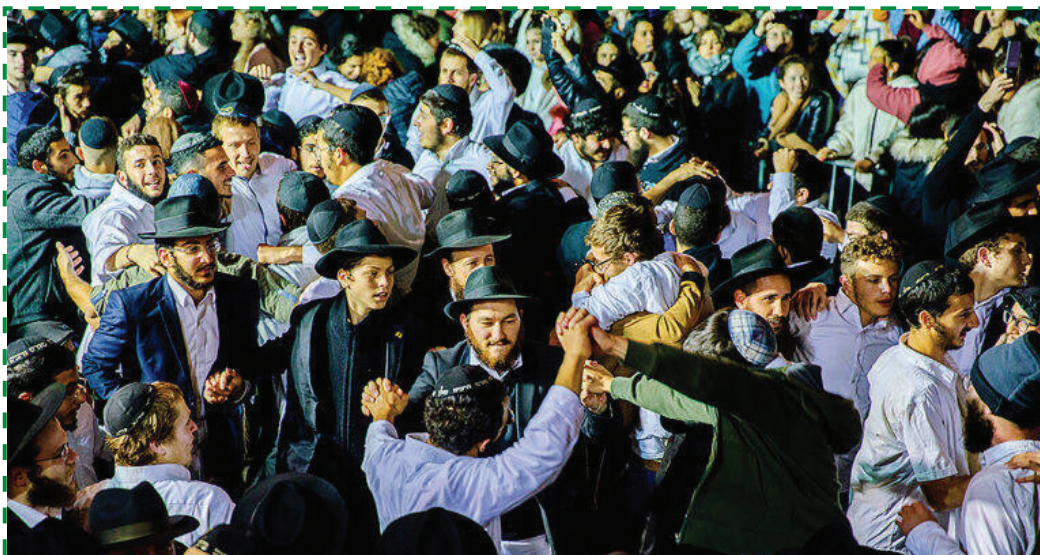
Szimchát bét hásoévá ünnepség a Chábád mozgalom New York-i központjában

Emberek ezrei vettek részt azon a koncerten, amit Halléban tartottak az antiszemita terrortámadás áldozatainak emlékére. A német városban egy szélsőjobb oldali támadó két embert ölt meg Jom Kipurkor. A 27 éves, erősen felfegyverzett férfi többször is megpróbált betörni a zsinagógába, ahol legalább 80-an tartózkodtak az ünnep miatt. Amikor ez nem sikerült, válogatás nélkül gyilkolt az utcán. A koncertet (aminek „Halle együtt” volt az elnevezése) a város és több médiavállalat szervezte, hogy határozottan kiálljanak az antiszemitizmus és az idegengyűlölet ellen.