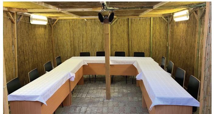
Kóser szukká (Szentendre, 2019)

4. Ugyancsak a sátorjellegből következik, hogy a szukkát a sza-