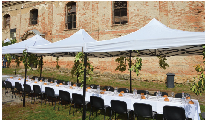
A nem kóser sátor

A napokban kaptam egy képet egy ismerősömtől, ami egy szukkoti ünnepségen készült, amit egy alapítvány szervezett nagyköveteknek és más illusztris vendégeknek vidéken. Szerintem ez a kép nagyon jól illusztrálja, hogy hogyan ne