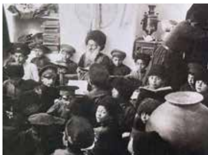
Tanítás a hegyi zsidók iskolájában, Quba, 1920-as évek

sel a Perzsa Birodalom elismerte Oroszország fennhatóságát a terület felett. A XX. században Azerbajdzsán előbb a Szovjetunió egyik tagállamává, majd 1991-ben önálló, független állammá vált.