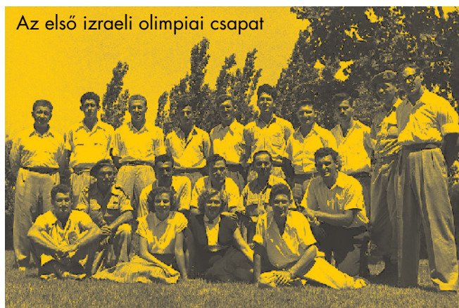
Az első izraeli olimpiai csapat