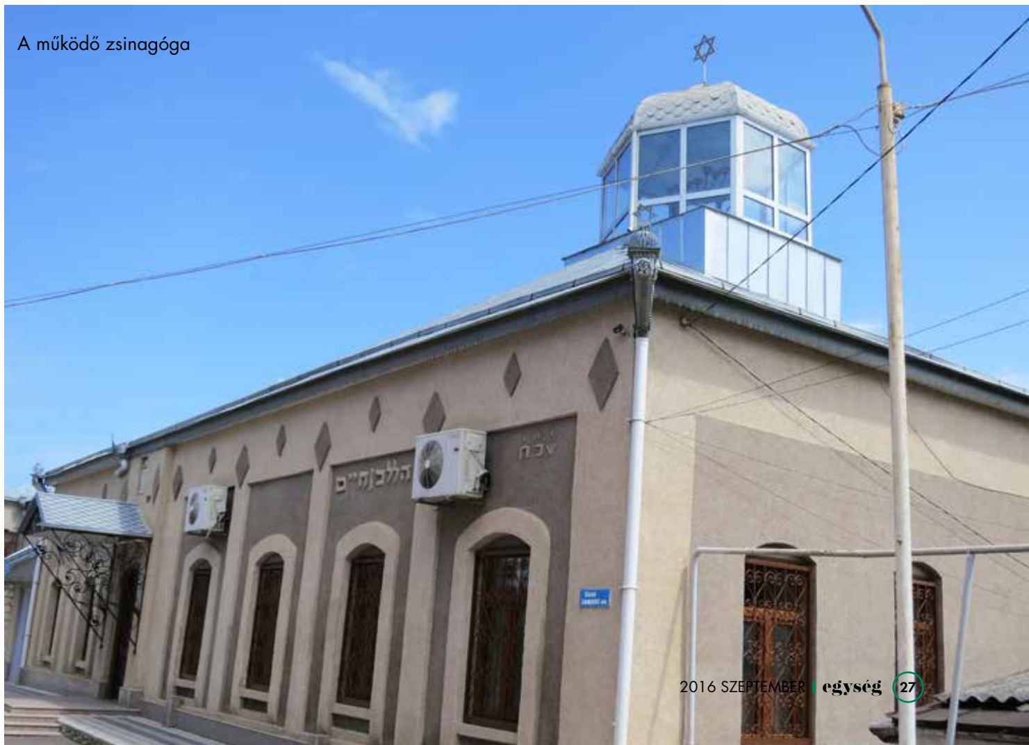
A működő zsinagóga