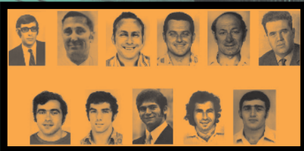
Balra: A müncheni áldozatok

ők is észrevétlenül elhagyták a helyszínt. A terroristák végül tizenegy túszt ejtettek.