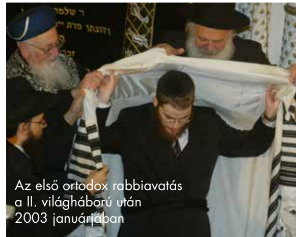
Az első ortodox rabbiavatás a II. világháború után 2003 januárjában

kezhettem Magyarországra ortodox rabbinak. Kevesebb mint másfél év-tizeddel érkezésünk után pedig az első magyar születésű honi ortodox rabbiavatását ünnepelehetjük, amelyet azóta számos hasonló követett és fog követni az Örökkévaló segítségével.