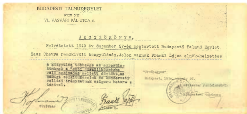
Az 1949. évi rendkívüli közgyűlés jegyzőkönyve

Végül 1949-ben a Budapesti Talmud Egylet, mely egykor lehetőséget adott arra, hogy a konzervatív zsidók elkülönüljenek a reform