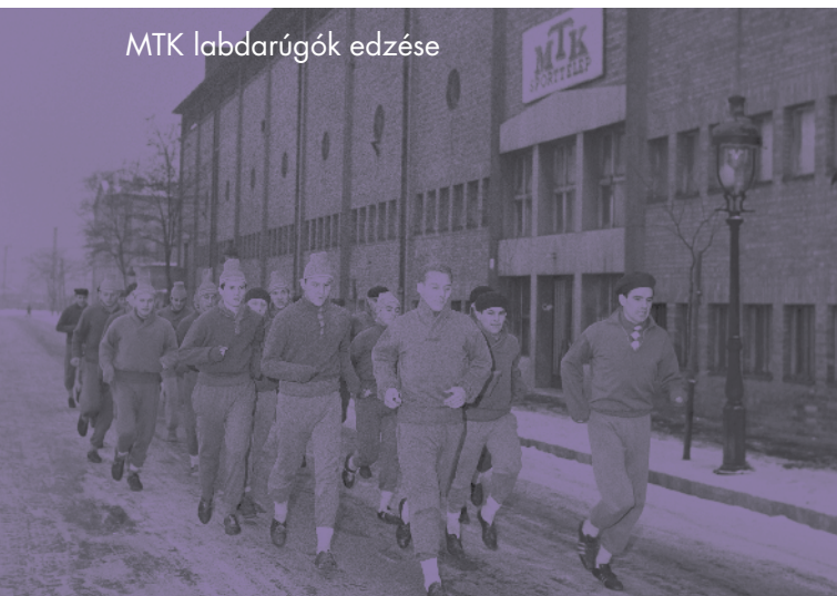
MTK labdarúgók edzése

Az első Maccabi Játékokat 1932. március 1-jén nyitották meg. Az első zsidó olimpián 390 sportoló vett részt, 18 országot képviselve. A rendezvény sikerén