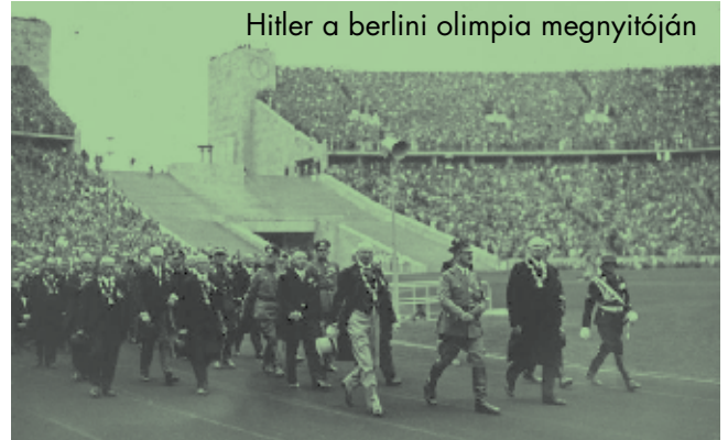
Hitler a berlini olimpia megnyitóján

akit az olimpia előtt zárták ki a Honvéd Tiszti Vívó Klubból, majd a MAC-ból a származása miatt. Ugyanígy zsidó volt a győzelmet szerző férfi vívócsapat tagjai közül az összesen háromszoros olimpiai bajnok Kabos Endre is.