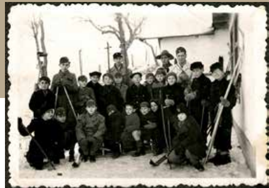
A Wesselényi utcai iskola Ezüst farkas cserkészcsapata

A világháború utáni forradalmi idők viharai megtépázták a magyar cserkészletet, és az azt követő zsidóellenes megtorlások során az újjászerveződő cserkészszövetségbe lehetőleg nem vették be a zsidó csapatokat. El is érték, hogy – az egyetemek, főiskolák mintájára – itt is bizonyos „numerus clausus” érvényesült. Lehetőleg vallásilag homogén, csak zsidó vagy csak keresztény csapatokat szerveztek, a keresztény