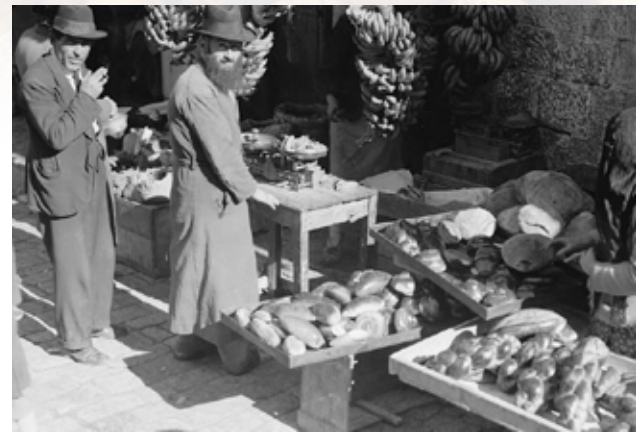
Kenyérárus Meá Seárim piacán, 1935

Izraelben mindenféle megtalálható az eredetileg az Ottomán Bi-