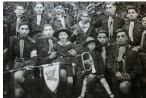
Farkas őr (1924)

1941 novemberétől a BM betiltotta az amúgy is már feloszlatott zsidó cserkészcsapatok minden működését. Megható olvasni búcsúparancsukat: „Szolgálat: A cserkészmunka újabb megindulásáig a