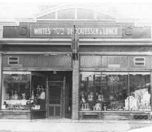
Kóser üzlet New Yorkban

Az 1880-as és az 1920-as évek között a kelet-európai zsidóság mintegy egyharmada kerekedett fel, és keresett új hazát magának. Túlnyomó többségük Amerikába vándorolt. Érkezésük teljesen át-