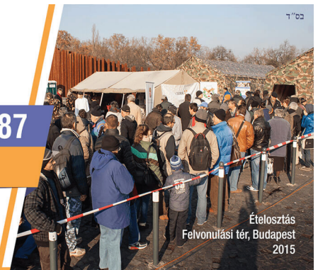
Ételosztás Felvonulási tér, Budapest 2015