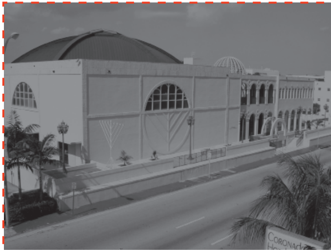
A Levi Yitzchak zsinagóga Bal Harbourban

Egy másik alkalommal a Rebbe azt kérte, hogy tegyünk ki egy nagy hanukai menórát a házunk elé. „Akkora legyen, hogy bevilágítsa az egész utcát!” – mondta. Még azt is elintézte, hogy kapjunk egyet, így mire visszaértünk New Yorkból Flori-