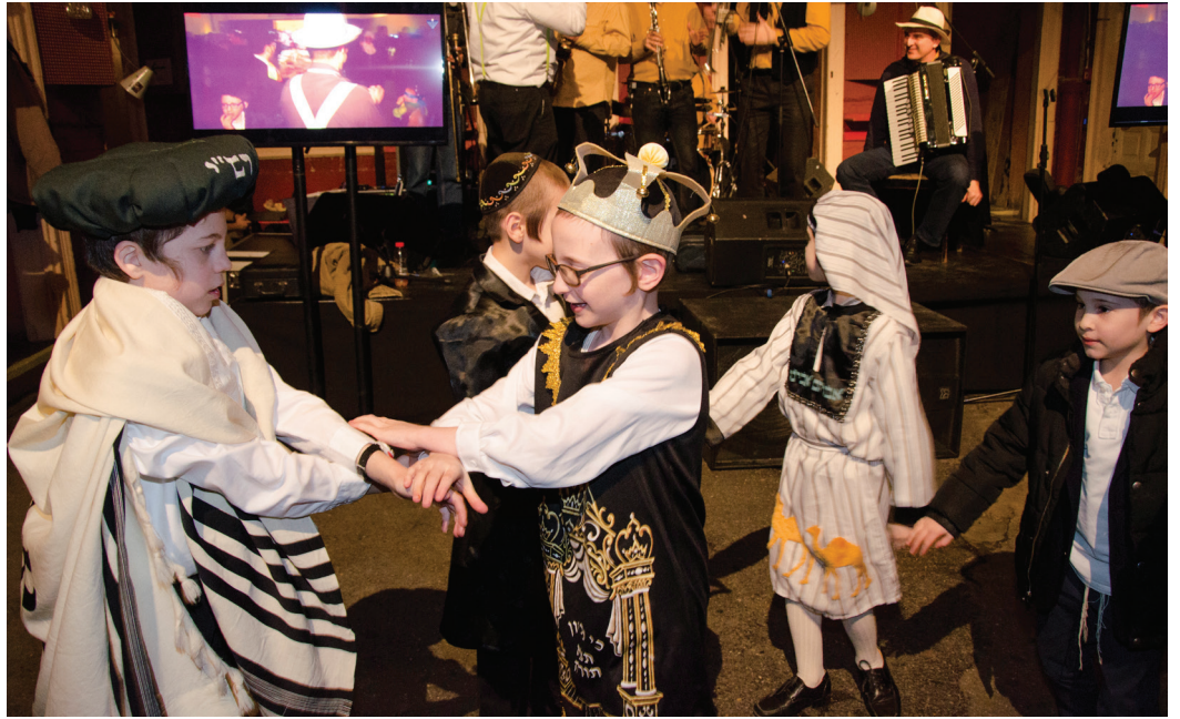
Positív tartalmú jelmezek: a cádik a Tóra tekerccsel táncol egy budapesti purim ünnepségen

Végezetül közismert oka a beöltözésnek, hogy Purim csodája egy rejtett csoda, ellentétben például a tenger kettéválásával. A purimi csoda, ami Eszter kérésének nyomán érkezett, el van fedve, „be-