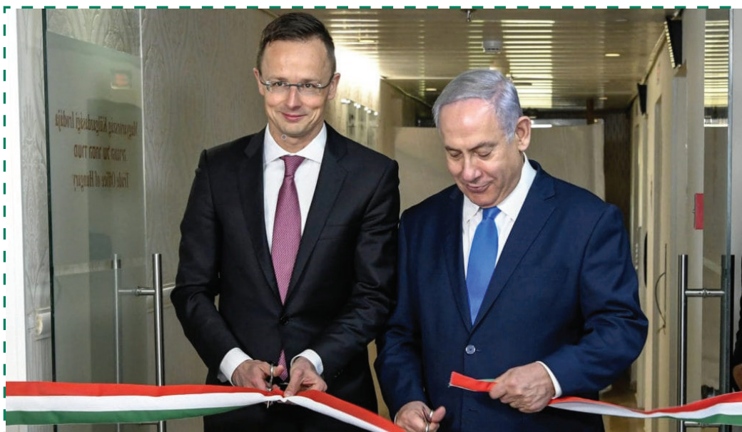
Benjámín Netanjahu és Szijjártó Péter felavatják a külgazdasági képviseletet

Csütörtökön emlékeztek meg a Bét Menáchem iskolában az 1848. március 15-i eseményekről. Külön kiemelték, hogy milyen fontos szerepük volt a zsidóknak a szabadságharcban. A gyerekek lelkesen készültek az ünnepi műsorral, és adták elő társaiknak.