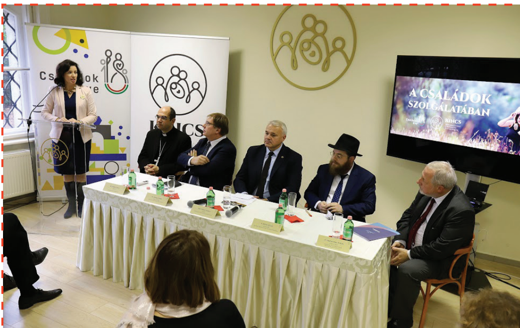
Egyházak a családok szolgálatában – Fotó: KINCS

Több, mint hatvan könyve jelent meg, ezek a holokauszt-kutatás alapját képezik, közülük is kiemelkedik a Magyar holocaust (A népirtás politikája) című műve, ami alapvetése a nemzetközi holokauszt-szakirodalomnak. 1979-ben részt vett az első amerikai holokausztmúzeum megalapításában Washingtonban.