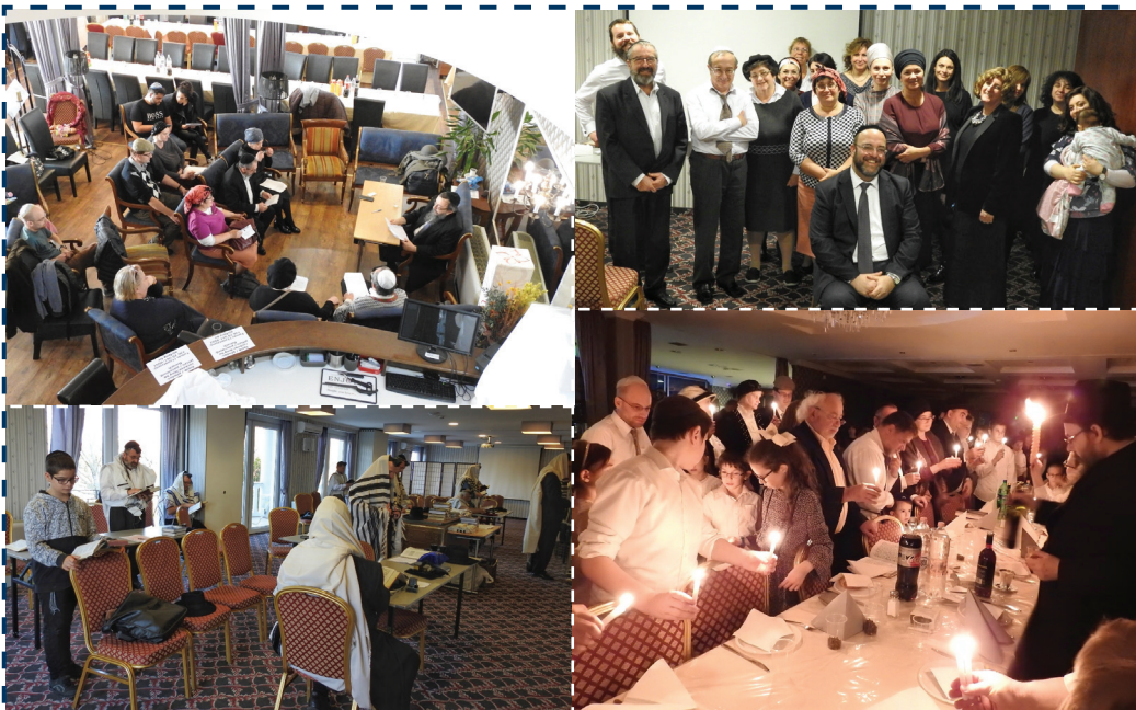
Életképek Ráckevéről

További részletek a zsido.com facebook oldalán és a www.zsido.com honlapon