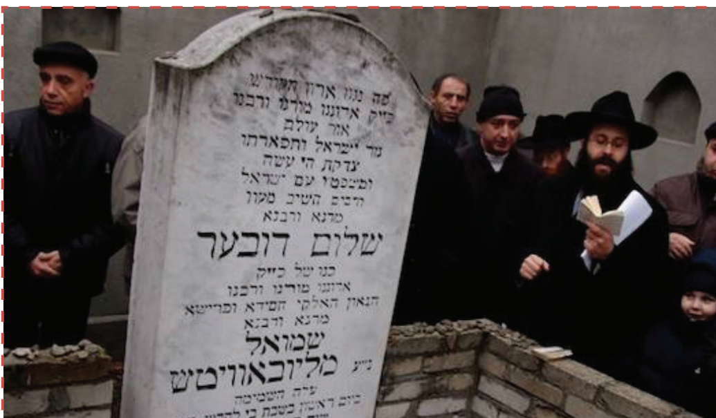
Megemlékezők Rebbe RásÁB sírjánál

További információ és jelentkezés a 268-0183-as telefonszámon vagy a posta@zsido.com címen.