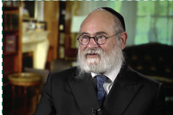
Binyomin Jacobs rabbi 1984 óta Hollandia főrabbijaként szolgál. Lánya és veje egy időben a budapesti zsidó közösséget segítette. Az interjú 2015 novemberében készült.

meg ettől a beosztástól. Igazi áldás, hogy szükségem szenvedő embereket szolgálhatok. Van itt háborús traumán átesett páciensek, tanulási nehézséggel küzdő gyermekek, és mentális vagy genetikai rendellenesség-