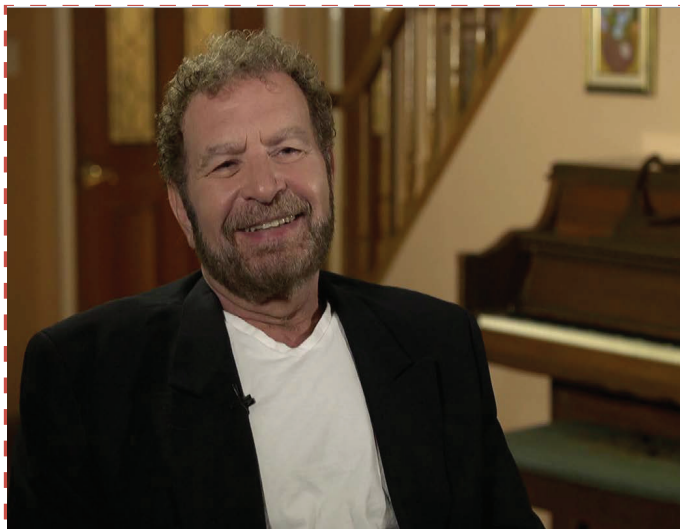
Dudu Fischer híres izraeli kántor, aki Tel-Avivban, Londonban és New Yorkban is eljátszotta Jean Valjean szerepét. Az interjú 2015 júliusában készült.

Két évvel anyám születése után a nagyszüleim elhagyták Lettországot és a Szentföldre költöztek. Még éppen időben. A