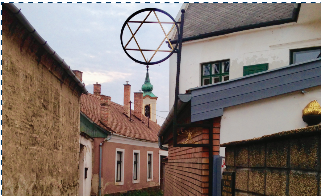
Szántó emlék- és imaház