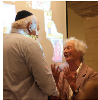
Találkozás 70 év múltán