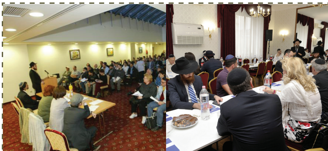
EMIH alakuló ülés, 2004 – EMIH közgyűlés, 2018