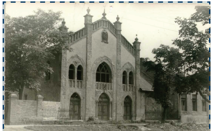
A hatvani zsinagóga 1955-ben