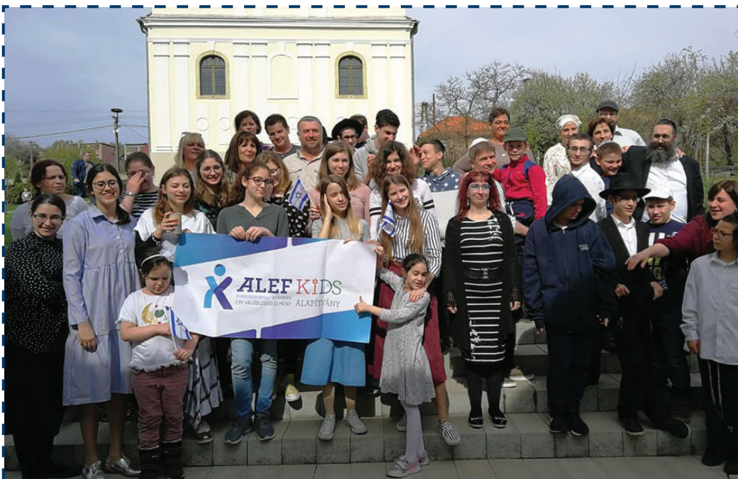
A mádi zsinagóga előtt az AlefKids csapata

A program jó lehetőséget kínált arra is, hogy a kisebbek betekinthesse a BMC programba: „Nagyon jó volt látni, hogy a kicsik mennyire érdeklődtek a BMC programok iránt és milyen vágyakozva hallgatták az élménybeszámolókat. Biztosak lehetünk abban, hogy az utánpótlás már készen áll.”