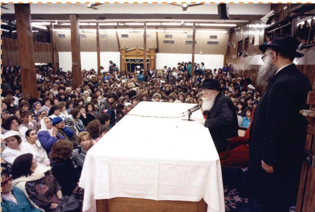
A Rebbe a Neshei Chabad rendezvényén beszél