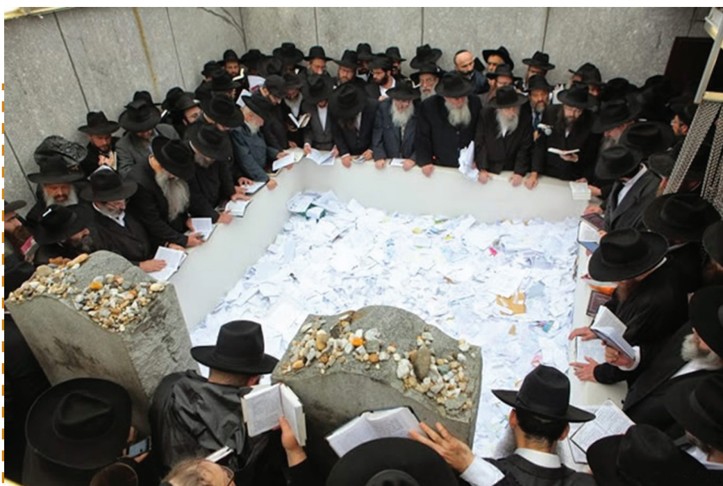
A lubavicsi rebbe Jozséf Jichák Schneerson és Menáchem Mendel Schneerson rabbi ohéljei

Jelentkezés: posta@zsido.com , 268-01-83