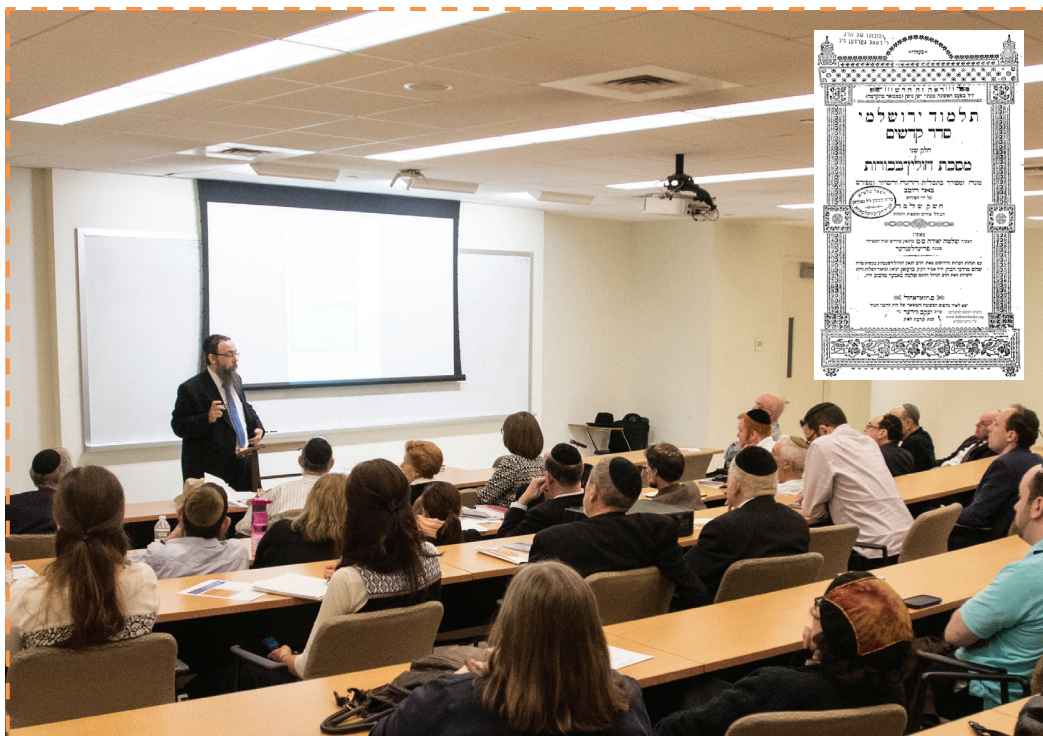
Az előadáson az egyetem több tanára is részt vett. Kiskép: Friedländer hamisítványa