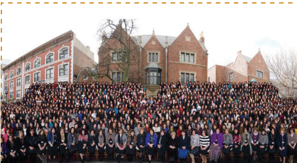
A 2016-os Kinusz HáSluchosz csoportképe

Különleges szombati programra várták a Bár Micva Klub tagjait Óbudán múlt szombaton. A BMC-s fiatalok közösen vettek részt a sábeszi imákon és étkezéseken, emellett játékokkal és tanulással telt a napjuk az Alef Központban rendezett sábatonon.