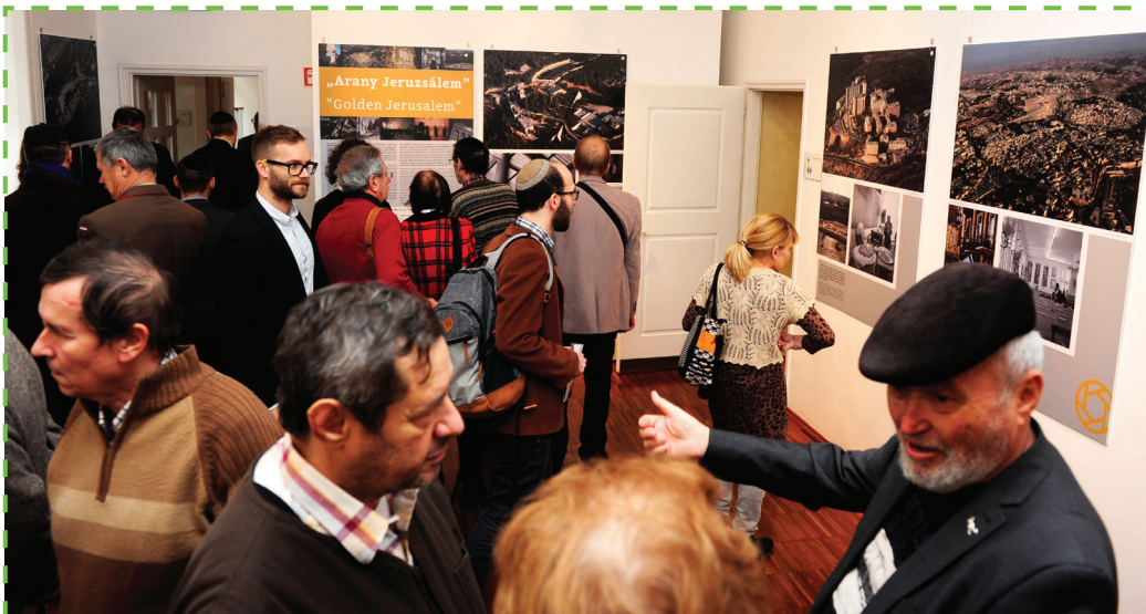
„Arany Jeruzsálem” – kiállítás-megnyitő