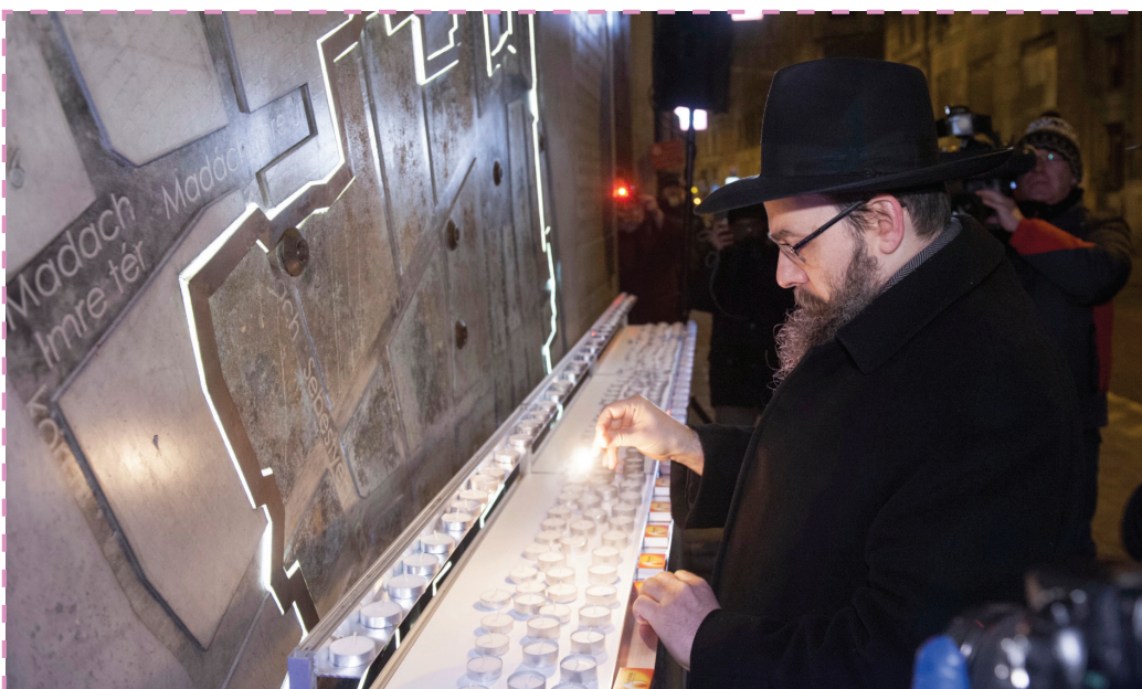
Emlékmécses-gyújtás a budapesti gettó felszabadításának évfordulóján (2017. január 17.)

További információ és jelentkezés: posta@zsido.com