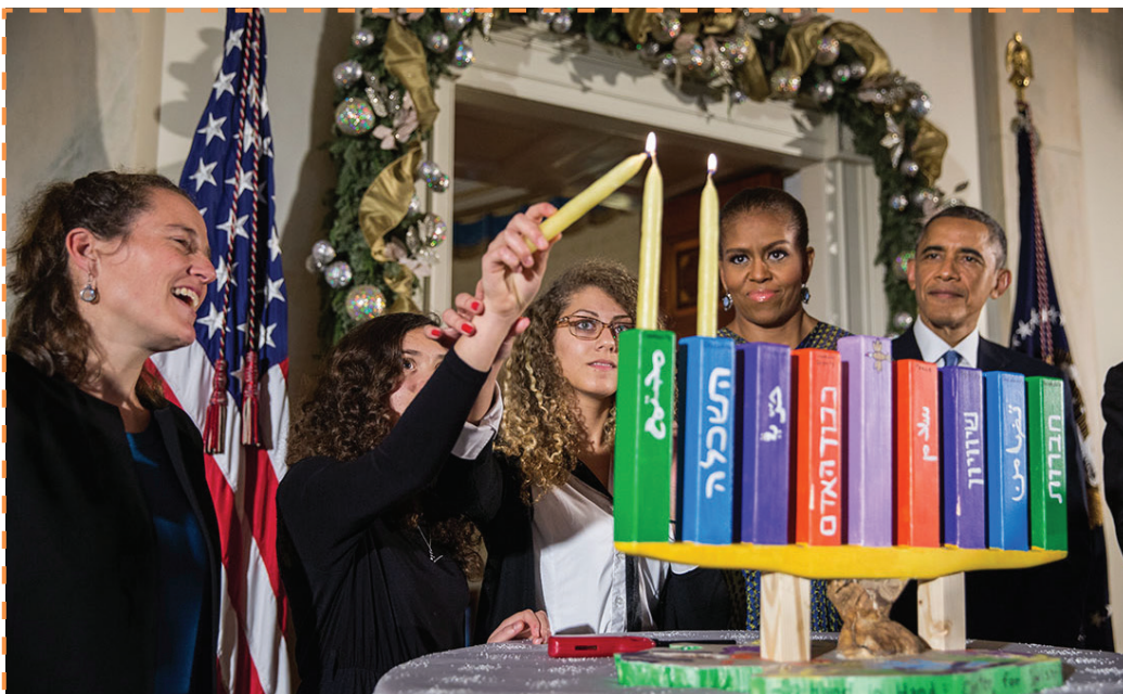
Utolsó gyertyagyújtás az Obama-érában

Közeleg a gyertyagyújtás ideje, amit mindenki izgatottan vár. Óvodásaink már meg is kezdték az ünneplést. Vidám kis műsorral készültek, amit be is mutattak szüleiknek, vendégeiknek. Mindenkinek boldog Hanukát kívánunk!