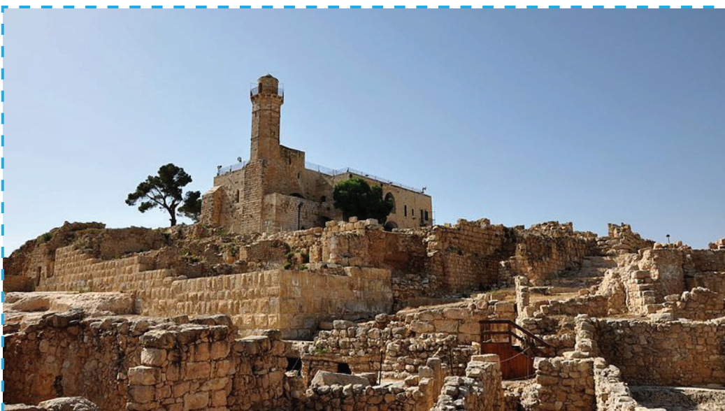
Az ájáloni csata színhelye