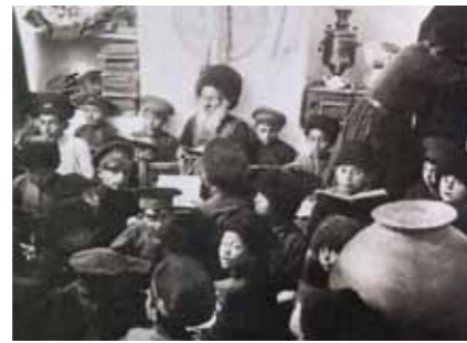
Tanítás a hegyi zsidók iskolájában, Quba, 1920-as évek

sel a Perzsa Birodalom elismerte Oroszország fennhatóságát a terület felett. A XX. században Azerbajdzsán előbb a Szovjetunió egyik tagállamává, majd 1991-ben önálló, független állammá vált.