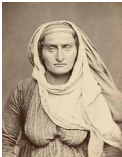
Dagesztáni zsidó asszony, 1880-90 táján

Dávid-csillagok és a túloldalon emelkedő mecsetek, minaretek. A temetőben néhány, a helyieknek jelentősebb személyiség sírja kiemelt helyen. Ők többnyire harcokban elesett, egykor innen elszármazott katonatisztek. Egy rabbi elkerített sírja feltűnően kiválik a sorból, érdekelhető, hogy sokan látogatják.