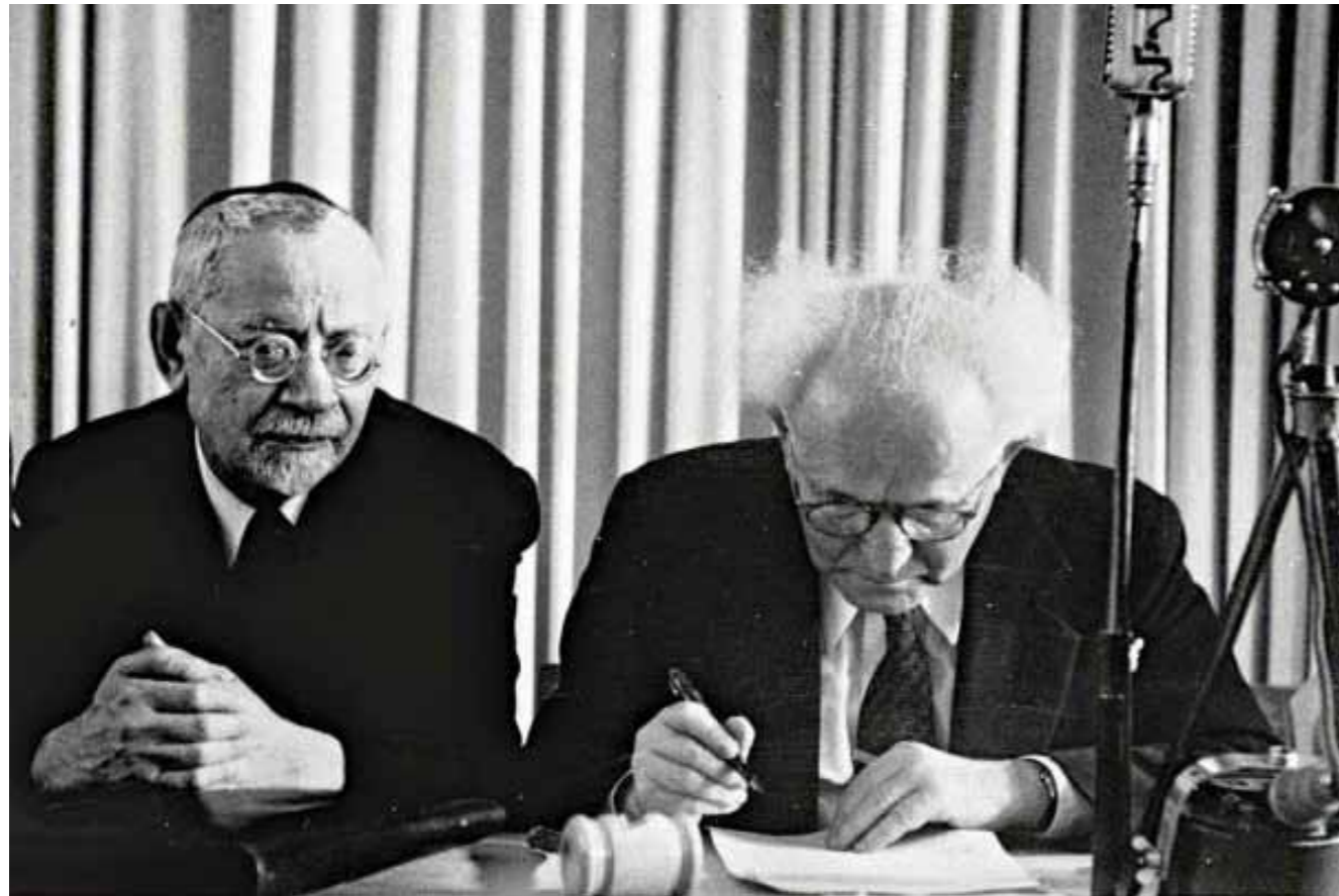
Ben Gurion a függetlenségi nyilatkozat aláírásakor. Mellette Jehudá Fischman-Májmon rabbi

Dávid Ben Gurion, Izrael mitikus államalapító miniszterelnöke finoman szólva sem tartozott a vallásos közösség tagjai közé. 14 éves volt, amikor az általa élete végéig nagyra becsült édesapja felfofozta, mert a fiatal Dávid felhagyott a filim (imaszj) tekerésével. Feleségével, Polával szándékosan nem vallásos szerződés keretei között esküdtött egy New York-i anyakönyvi hivatalban. Nem tartotta a bűnt jom kipur napján, és ha csak tehette, kerülte a kipa viselését.