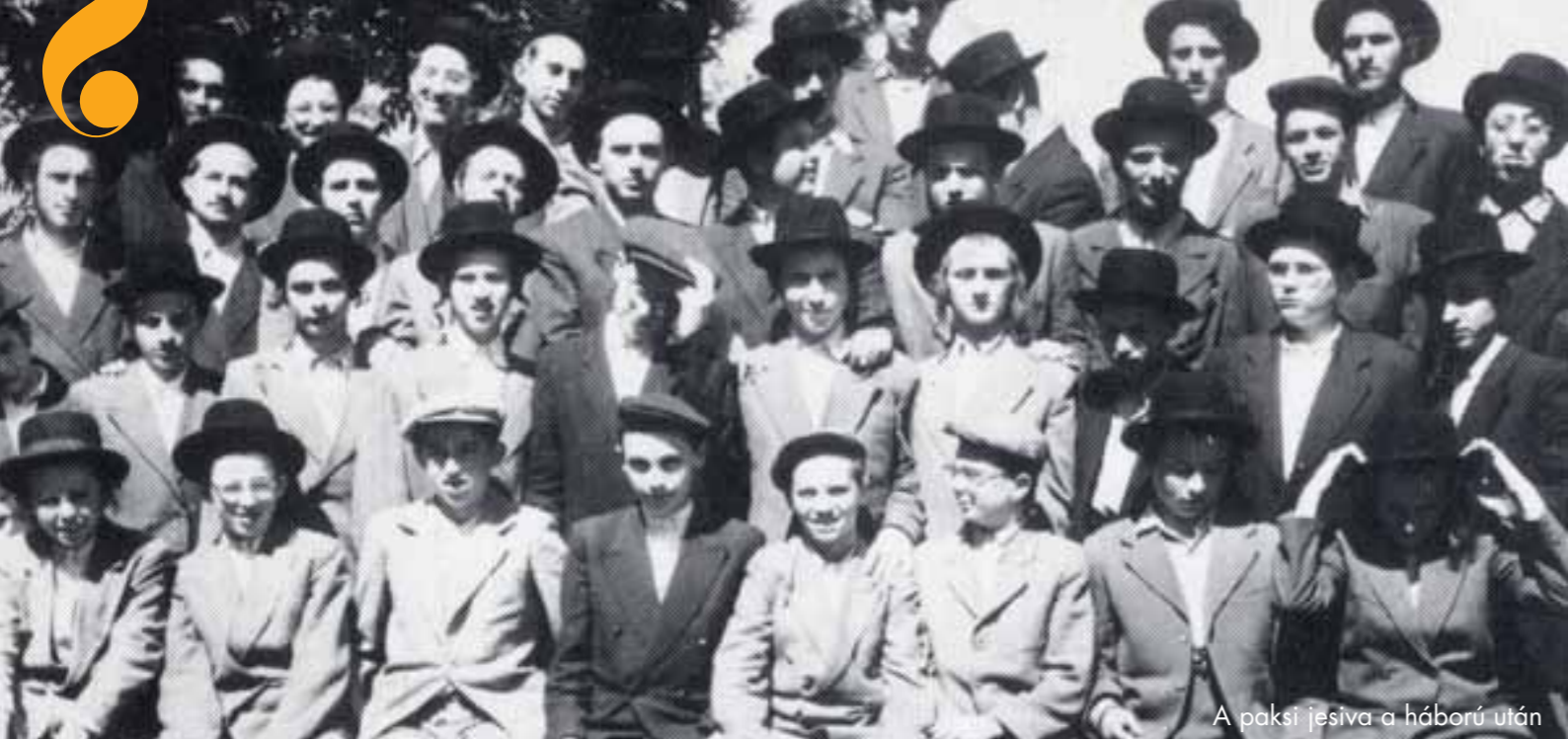
A paksi jesiva a háború után