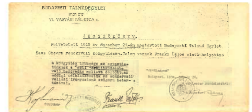
Az 1949. évi rendkívüli közgyűlés jegyzőkönyve

Végül 1949-ben a Budapesti Talmud Egylet, mely egykor lehetőséget adott arra, hogy a konzervatív zsidók elkülönüljenek a reform