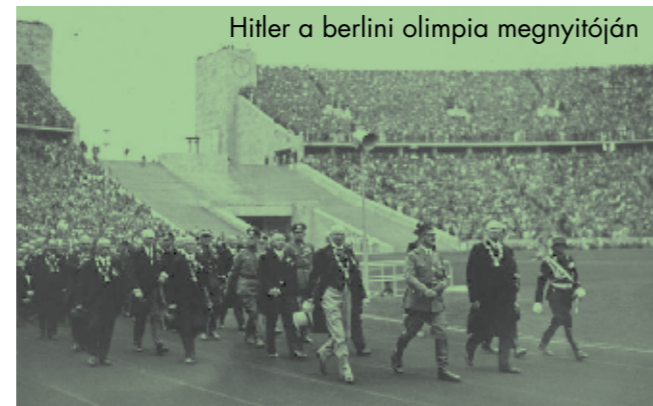
Hitler a berlini olimpia megnyitóján

Am a nemzetiszocialista rendszer és az új, emberellenes eszmék zavartalan diadalútját számos, a rendezők számára kellemetlen győzelem árnyékolta be. Az olimpia legeredményesebb versenyzője a színes bőrű Jesse Owens lett. Az amerikai atléta nem kevesebb, mint négy aranyérmet szerzett, 100 és 200 méteres síkfutásban, a 4x100 méteres váltóban és távolugrásban. Hitler nem volt hajlandó gratulálni a kiváló sportembernek. Ugyanígy rosszul érintette a szervezőket a számos, zsidó sportoló által elért nagyszerű eredmény. Éppen egy német versenyző felett aratott például diadalt a magyar sport első női olimpiai aranyérmese, a törvívó Elek Ilona,