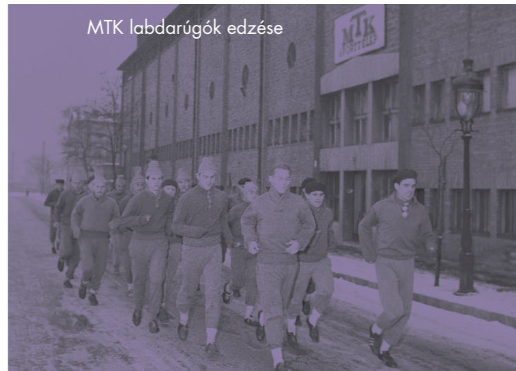
MTK labdarúgók edzése

játékokon lovas számokban versenyző, Cseh Kálmán alezredes parancsára a keretlegények előbb egy fához kötötték, majd addig locsolták vízzel, amíg a dermesztő hidegben meg nem fagyott.