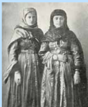
Dagesztáni zsidó lányok

Szombatra és ünnepnapra az asszonyok sokféle ételt készítettek: sült marhahúst, csirkével dúsított piláfot, zöldfűszerekből álló szósszal feltálalt sült halat, padlizsánt és más zöldségeket. A hegyi zsidók étkezés előtt és utána is teáznak. Az ünnepi étkezéseknek természetesen része a bor is, melyet sok esetben saját maguk készítettek, hiszen a kaukázusi zsidók közül sokan foglalkoztak borkészítéssel. Kaukázusi szomszédaiak kesernyész, zöld szilvából készített lekvárját, a metet a helyi zsidók is előszeretettel készítik.