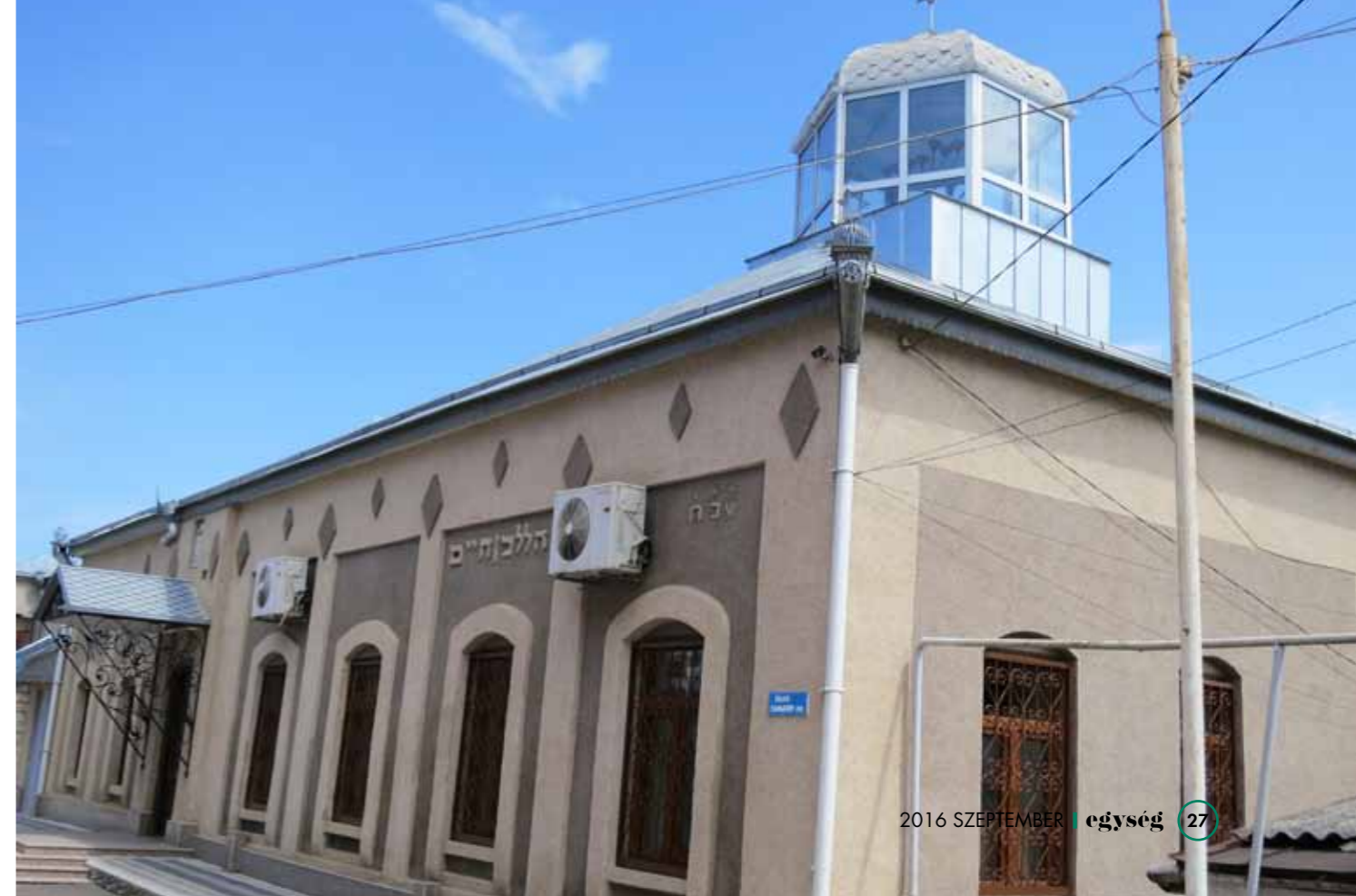
A működő zsinagóga