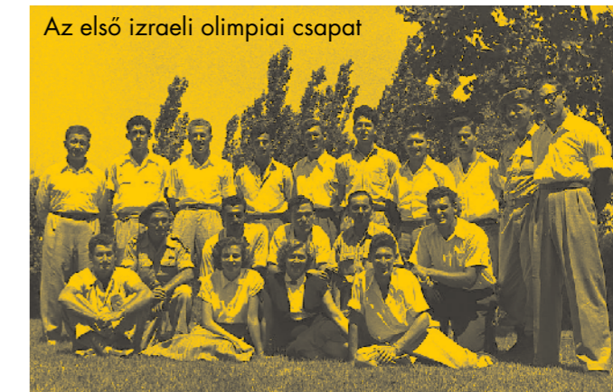
Az első izraeli olimpiai csapat

A Maccabi Játékok ötlete egy orosz származású zsidó fiatalember, Jozsef Jekutielitől származik, aki az 1912-es Stockholmban rendezett olimpia után kapott egy füzetet, amely a játékokon szereplő zsidó sportembereket