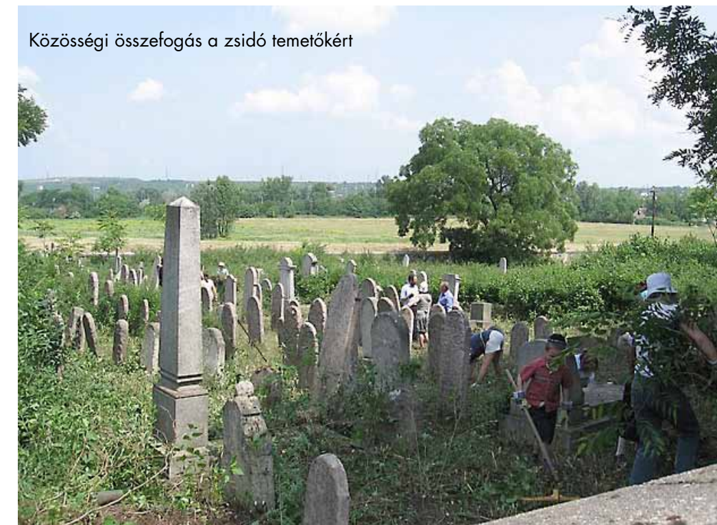
Közösségi összefogás a zsidó temetőkért

Annál a hatszázötven temetőnél, amelynél szerződést kötött a MAZSIHISZ és az önkormányzat, elmondható, hogy létezik karbantartás, amely persze örök kritika tárgya lehet, ugyanis a gondozottság szintjének megítélése azért erősen szubjektív dolog. Általában akkor sikerül létrehozni egy ilyen együttműködést, ha valaki személyesen kötődik az adott temetőhöz, vagy az adott település évforduló előtt áll. Jó példa Bakonytamási, ahol az önkormányzatnak volt egy kis pályázati pénze a kerítés felújításához. Ott sikerült is találnia Winkler Miksának pár olyan családot, akik kötődtek a temetőhöz, és még a hitközség is be tudott szállni a munkálatokba. Ennek a végeredménye pedig most egy nagyon szépen felújított, rendben lévő temető. „De az 1600 temetőhöz képest ez nyilván elenyésző” – fogalmazott a Mazsihisz képviselője. Hozzátette: nagyon ésszerű, jól átlátható programra van szükség. Arra a kérdésünkre, miszerint mikor lesz látható eredménye a programnak, Winkler Miksa azt mondta, hogy egyelőre ezt nehéz megítélni, de valószínűleg jövőre.