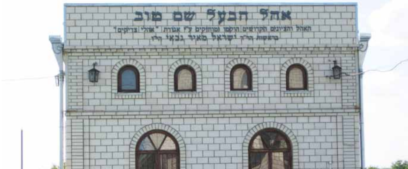
A Bádál Sém Tov ohelje