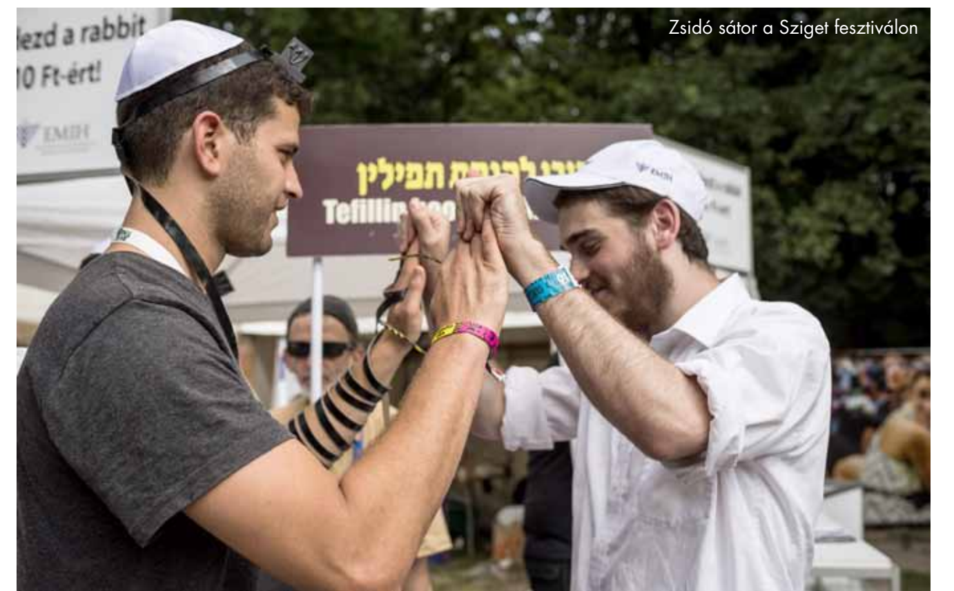
Zsidó sátor a Sziget fesztiválon

Igazából ez a kérdés: ahogy a Salzburgi fesztivál nem képzelhető el Mozart nélkül, a zsidó fesztiválok nem a zsidó tartalom tenné egyedivé és különlegessé?