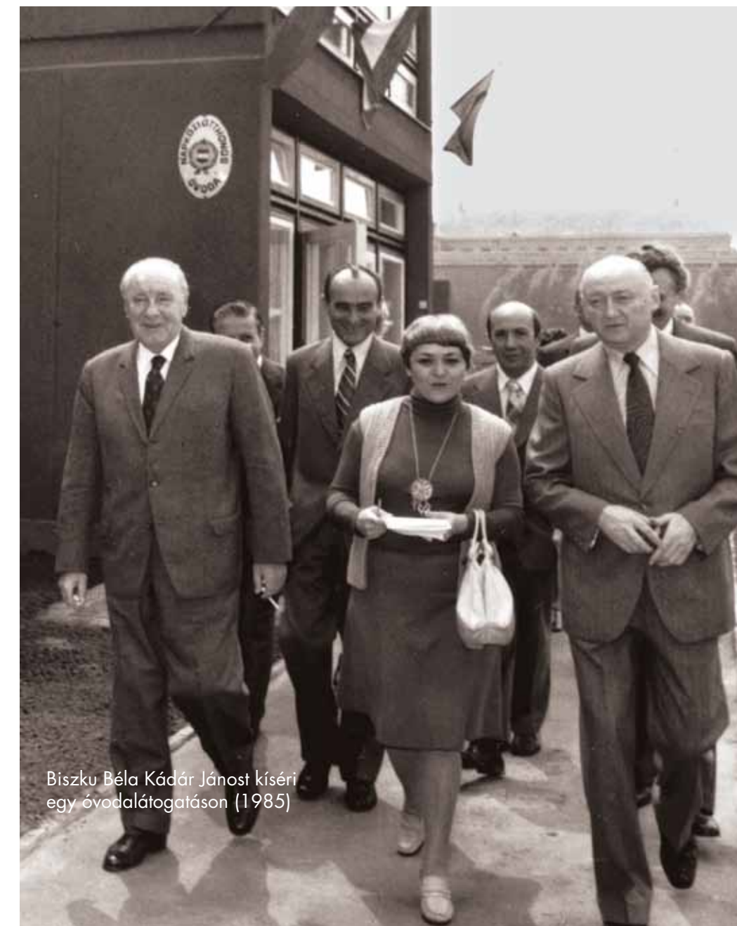
Biszku Béla Kádár Jánost kíséri egy óvodalátogatáson (1985)

A Sulchán áruch 11 azt írja: nem szabad azoknak a bűnös pogányoknak a halálát okozni – akár indirekt módon –, akik nem állnak háborúban velünk, mert a bűnösök fölött csak bíróság ítélkezhet. Szabad-e azonban kifejezetten meggyógyítani? Nos, a Sulchán áruch szerint 12 , csakis akkor ha az alábbi négy szempont közül valamelyik fennáll: