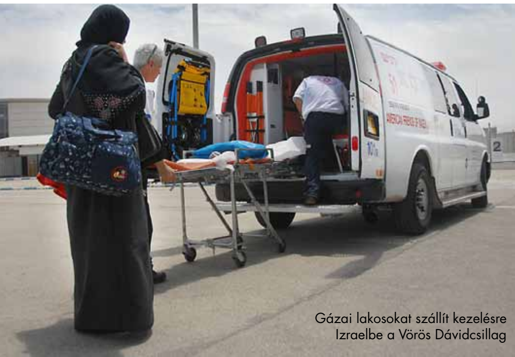
Gázai lakosokat szállít kezelésre Izraelbe a Vörös Dávidcsillag