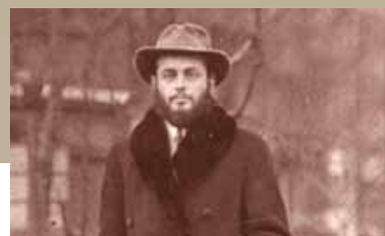
Schneerson rabbi a világháború előtt

A Rebbe számos alkalommal szolt tudomány és hit viszonyáról, különféle mélységekben fejte ki a témát. Ami a kettő közti látszólagos feszültséget illeti, a Rebbe nem kedvelte az „apologetikus” megközelítést, mely a szentírási szakaszokat és a hit tételeit a kor tudományos keretelméleteihez igazodva kísérel meg újraértelmezni. „Volt idő – írja a Rebbe egyik levelében –, amikor a tudósok úgy vélték, van olyan »tény«, amit tudományos módszerekkel »igazolni« lehet. Ma viszont inkább az az általános vélemény, hogy a tudományos módszer nem »igazol« tényeket, hanem több-kevesebb valószínűséget rendel egyes hipotézisekhez. A hívő zsidónak, aki olyan dokumentumot tart a kezében, melyről tudja, hogy a világ Teremtőjének kinyilatkoztatott szavát tartalmazza, s a mondott Teremtő törvényeit, semmi oka rá, sőt, semmi tudományos