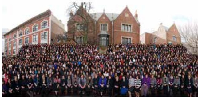
2016 INTERNATIONAL CONFERENCE OF SHLUCHOS LUBAVITCH WORLD HEADQUARTERS | CROWN HEIGHTS, NY

A mozgalom jellegzetes intézménye a chábád központ, más néven chábád ház, melyet minden olyan településen vagy kerületben felállítanak, ahol rabbit, illetve közösséget tartanak fenn. Ezen intézmények sokféle