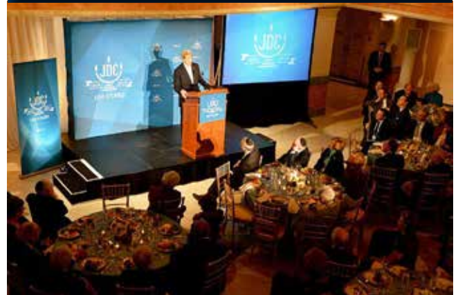
John Kerry beszédet mond a JOINT fennállásának 100. évfordulója alkalmából rendezett banketten

A szervezetet 1914-ben, az első világháború kitörése után alapították, amikor az államalapítás előtti Palesztinában élő, mintegy 59000 zsidónak volt szüksége azonnali, nagymértékű segélyre, mivel a háború miatt minden bevételi forrásuk elapadt. A második világháború után a Jointnak igen nagy szerepe volt a megmaradt európai – többek közt a magyarországi – zsidóság