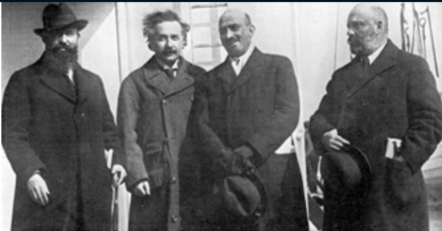
Einstein a WZO vezetőivel

A Cionista Szervezetet Theodor Herzl alapította 1897-ben, a bázeli Első Cionista Kongresszuson, és 1960-ban változtatták nevét Cionista Világszervezetre. Eredeti törekvése az volt, hogy segítségével legális zsidó államot hozzanak létre Palesztinában. Céljai az 1948-as államalapítás után megváltoztak és a bevándorlás segítése, valamint a különféle cionista szervezetek támogatása és összefogása lett a feladata. Míg eredetileg bárki tagja lehetett, addig 1960 óta csak szervezetek válhatnak tagokká. Tagjai között szerepelnek vallásos és világi tömörülések, nőjogi szervezetek, diák- és sportszervezetek, és a 2002-ben megtartott 34. kongresszus óta már egy Zöld Cionista Szövetség nevű zsidó környezetvédelmi szervezet is. A WZO legfőbb törvényhozó szerve a Zsidó Világkongresszus, mely az elmúlt évtizedekben 4-5 évente ül össze Jeruzsálemben. A következő, 38. kongresszusra 2020-ban kerül majd sor.