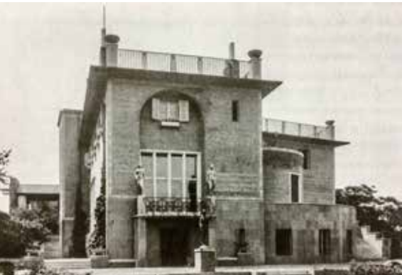
Grünwald-villa az Ostrom utcában

Grünwald Mór (1868–1918) tehető építész volt, aki fivéreivel már régebb óta jól menő építési vállalkozásukat vezette; önálló tervezésű bérháza, a „19. századi Budapest cifra palotája” (Rákóczi út 30.)