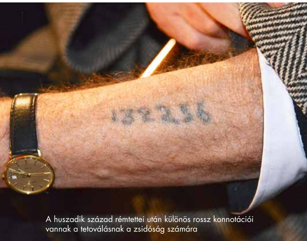
A huszadik század rémtettei után különös rossz konnotációi vannak a tetoválásnak a zsidóság számára