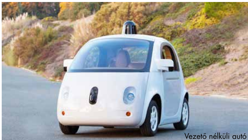
Vezető nélküli autó

mos területen vették át az ember feladatát. „Ezzel együtt hiszek abban, hogy a változások ellenére az embereknek is mindig lesz szerepük. Mindig szükség lesz azokra, akik megjavítják az elromlott gépeket, és új programokat dolgoznak ki.”