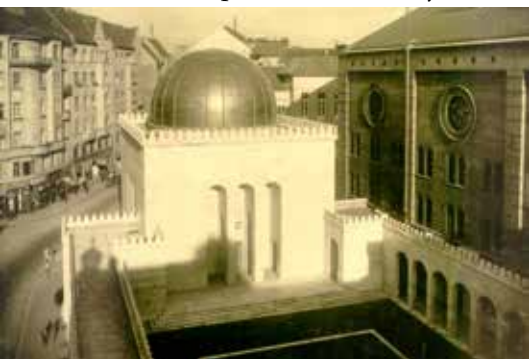
A Hősök temploma felülről

1928-ban pályázatot írtak ki a Hősök Templomára és környezetére.