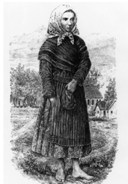
Solymosi Eszter Ábrányi Lajos rajza

A magyarországi vérvádak közül a bazini (ma Pezinok, Szlovákia) járt a zsidókra nézve a legsúlyosabb következményekkel. 1529-ben Bazin grófja vádolta meg a zsidókat egy kilencéves fiú kegyetlen meggyilkolásával és kivéreztetésével. Kínvallatás után 30 zsidót égettek el Bazin főterén, korra és nemre való tekintet nélkül, a többi bazini zsidót pedig azonnali hatállyal elűldözték a városból. A valóság azonban nem sokkal később kiderült. A gróf, Wolf Ferenc rengeteg adósságot halmozott fel a zsidóknál. Hogy ettől megszabaduljon, vérvádat koholt ellenük: a kisfiút Bécsbe csempészte, majd a kivégzések után nem sokkal visszaküldte a családjához. A következő évszázadokban rendre találkozhatunk vérvádakkal, Budán (ezt a spanyolországi származású udvari zsidó, Fortunatus Imre – Slomó ben Efrájim hiúsította meg II. Lajos király uralkodása idején), Csengeren, Péren, Nagyszombaton.