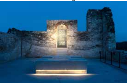
Az olaszliszakai zsinagóga romjai közt ma Holokauszt emlékmű áll

Messzeföldön híres volt tudásáról és szerénységéről, szinte aszketikus életmódjáról. A segítséget kérőktől kapott adományokat jótékony célokra fordította, árvákat és házasulandó lányokat támogató alapítványai a mai napig működnek szerte a világon.