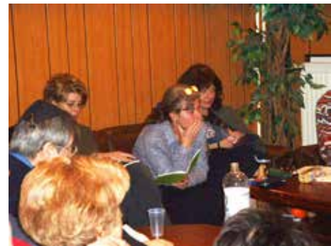
Pilisi hétféligé 2003.

Külön figyelmet szentelnek annak, hogy egész hétféligén legyenek gyerekprogramok és gyermekfelügyelet, így a szülők is élvezhetik az