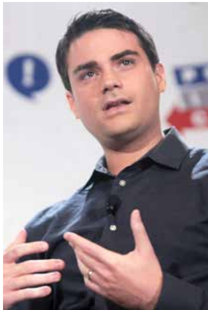
Ben Shapiro oldalát havonta 45 millióan olvassák

tudott azonosulni saját szerepével. Amint később visszaemlékezett: „Az alt-right számára a Breitbart vált a legkézenfekvőbb hírforrássá ... a politikai korrektségre adható legitim válaszként tölték a fehér etnonacionalizmust, és a kommentszekció a fehérek felsőbbrendűségét hirdető mémgyárosok pöcegödrevé züllött.” Az oldal leplezetlenül Donald Trump kampánylapjává alakult. Amikor 2016 márciusában a későbbi elnök