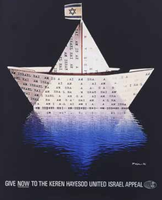
Egy csónakban evezünk – 1974-es plakát

jelentős, nem zsidó adományozónk, aki azért ad Izraelnek, mert ott igen szakszerű a hátrányos helyzetű gyermekek gondozásának rendszere és meggyőződött arról, hogy adománya valóban a gyermekek javát szolgálja. Zsidó adományozóink hozzáállása attól függ, hogy hogyan viszonyul az illető a cionizmus eszméjéhez.