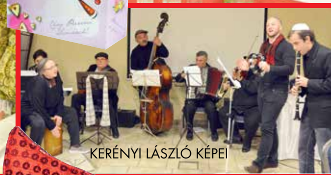
KERÉNYI LÁSZLÓ KÉPEI