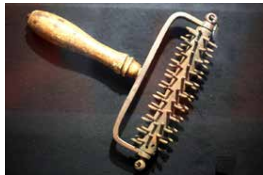
Macesz henger a 18. századból

két ok miatt mégsem vált hosszútávon bevett gyakorlattá. Egyrészt tartottak attól, hogy a tésztában egy kis lisztcsomó mégiscsak erjedésnek indul, mert elkerülte a folyamatos gyúrást. Másrészt idővel elterjedt az a vélemény, miszerint a 18 perc ösz-