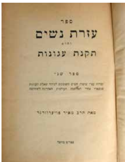
Meir Feuerwenger könyve

A mai napig vannak olyan személyek, akik a New York-i World Trade Center ellen 2001-ben elkövetett terrortámadás idejében tűntek el, de nem került elő bizonyíték a halálukra nézve. Ez az áginut klasszikus példája, ahhoz hasonló, mint amikor egy embert láttak bemenni a tengerbe (melynek nem lehet minden partját egyszerre megfigyelni), de nem látták kijönni onnan. Semmi sem bizonyítja, hogy valóban nem jött ki a tengerből (hiszen nem látunk minden