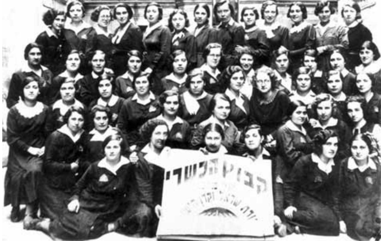
A Bét Jáákov lányiskola végzős növendéke 1934, Lodz