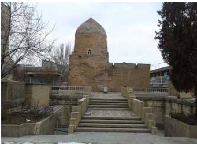
Eszter királyné sírhelye Iránban

nő példaképeként is áll előttünk. Nevének betűi a három női micvát: chálá (bizonyos mennyiségnél több lisztből gyúrt tésztaból levett papi adomány), nidá (házasági tisztaság) és hádlákát nérot (szombat és ünnepi gyertyagyújtás) adják ki. A prófétanők nemcsak az isteni üzenetet közvetítették, hanem koruk bölcs asszonyai is voltak, akiknek szavára királyok is hallgattak.