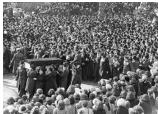
A Rebbe kíséri a Rebbecen koporsóját

Az Eastern Parkway mentén összegyűlt tömeg könnyek közepette hallgatta a Rebbe búcsúzó szavait, melyekkel szeretett feleségét méltatta. A Rebbe emlékére mondott kádis mellett Schneerson rabbi az emberekhez fordult és azt kérte tőlük, zárják szívükbe a Rebbe életétörténetét.