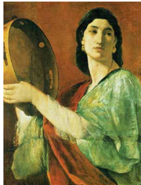
Anselm Feurbach: Miriam

Prófétanőből egyébként hét akadt összesen a zsidó történelemben: a már említett Szárá, Mirjám és Dvorá mellett Cháná (Smuél prófeta anyja), Ávigáil (Dávid király felesége), Chuldá és Eszter királyné tartozik közéjük. Cháná prófetasága mellett a zsidó