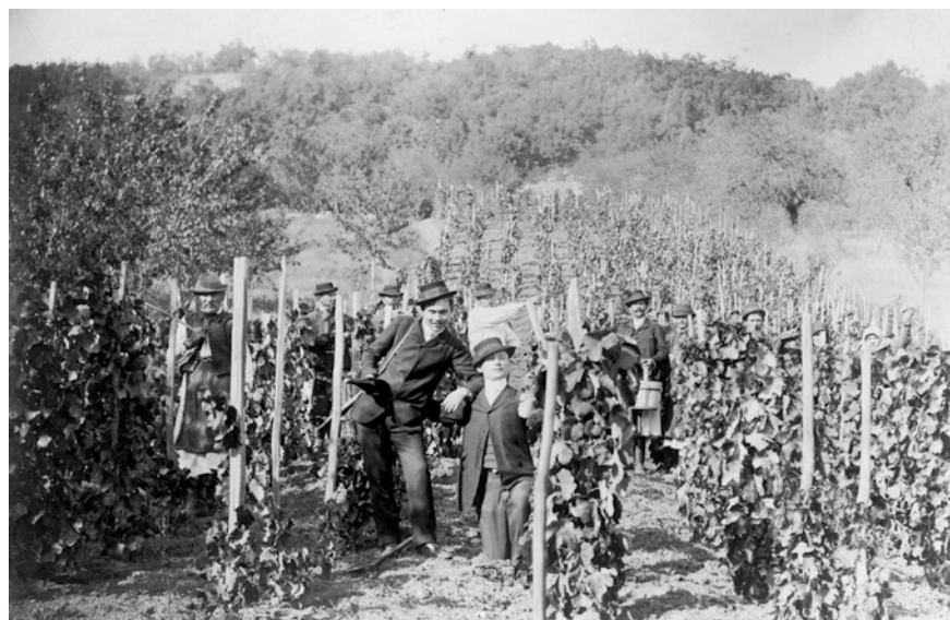
Szüret (Nagy Károly, 1928)

az adott település összes rabbijának felsorolása. Fölmerül a kérdés, hogy miért nem csak az érdekesebb rabbik szerepelnek, akikhez mondjuk valami könnyen emészthető, bulváros történet is tartozik (mint például a pénzhamisítási gyanúba keveredett