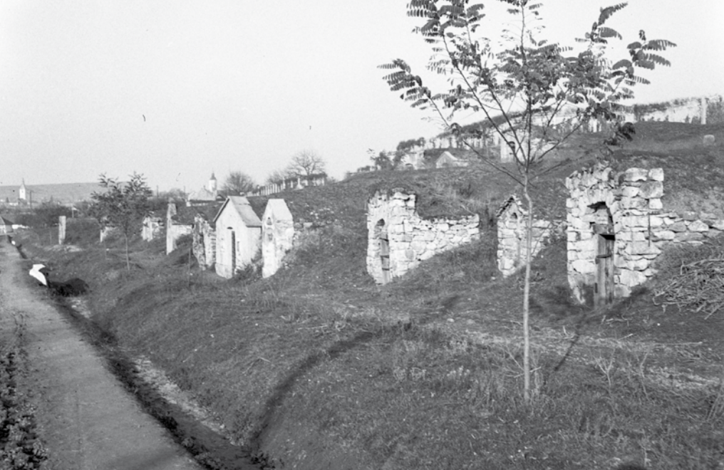
Abaújszántói borospincék (Lissák Tivadar, 1939)