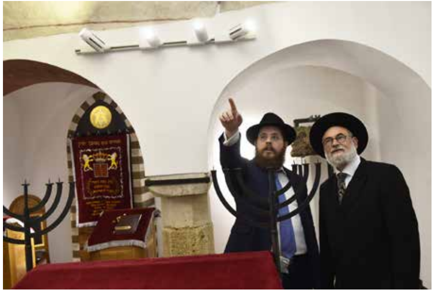
Köves Slomó és Binyomin Jacobs, Hollandia országos főrabbija

„Áldjon meg téged az Örökkévaló, és örizzen meg téged, világíttassa az Örökkévaló neked az ő szímet: és könyörüljön rajtad,