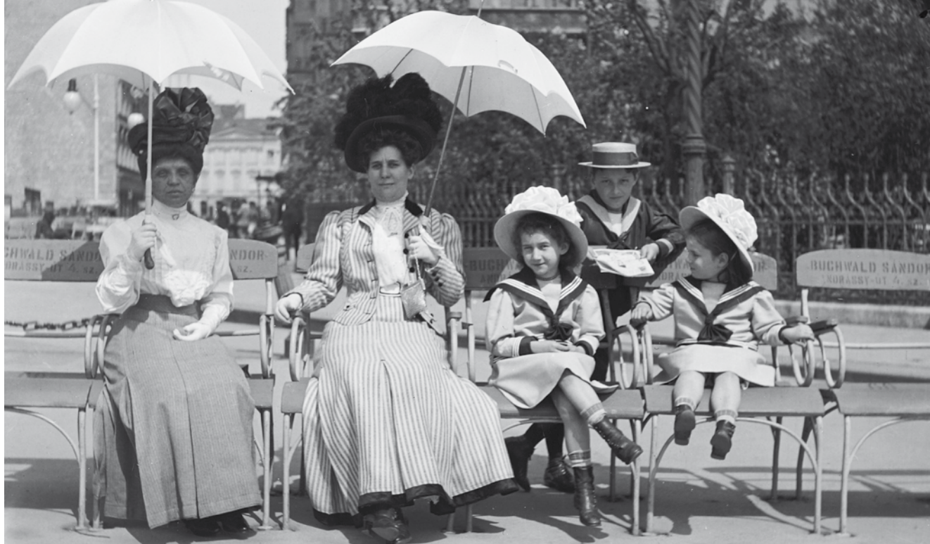
Buchwald Sándor (1837–1919) vasbútorgyáros bérelhető padjain pihenhettek meg a Vigadó előtt sétálók is 1909-ben”

de az észlelteket után legnagyobb fájdalomra attól kezdek tartani, hogy tervemmel elkéstem. A gazdag zsidó ifjúság nagy részének nincsenek ideáljai, nincs hite, nincs vallása és nincs elve; majmai a divatnak és rabjai az élvek hajhászásának. [...]