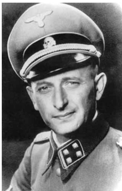
Dicsősége teljében és kalitkába zárva

1960. május 11-én, Eichmann napi rutinjának hosszas megfigyelése után a csapat annál a buszmegállónál várta őt, ahol munkából hazafelé menet nagyjából mindig ugyanabban az időben szállt le. Ketten „lerobbant” autójukat „javították”, egy harmadik, Peter Malkin Moszad-ügynök pedig odalépett „Klement”-hez, és cigarettát kért tőle. Amikor Eichmann, veszélyt érezve, menekülni próbált, a „szerelelők” Malkin segítségére siettek, és kocsijukba tuszkolták az elfogottat, akinek ruháját megtépvén keresték meg a két azonosító jelet: egy-egy forradást a karján és a hasán. Ezu-