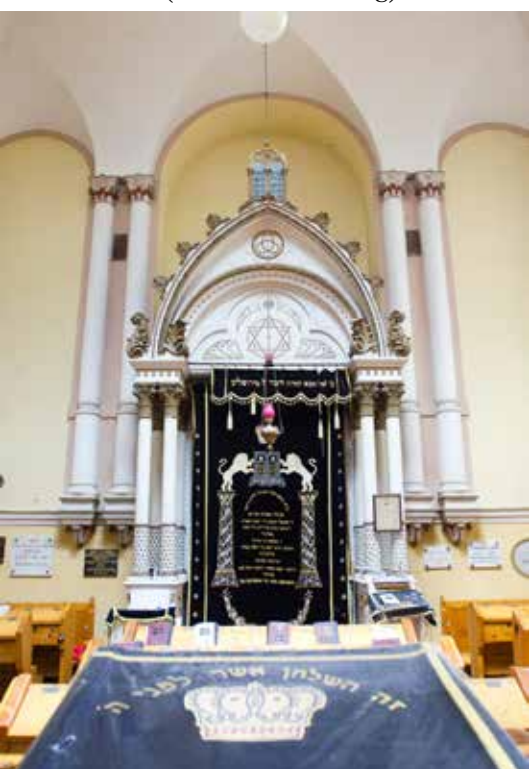
A Vasvári Pál utcai zsinagóga frigszekrénye