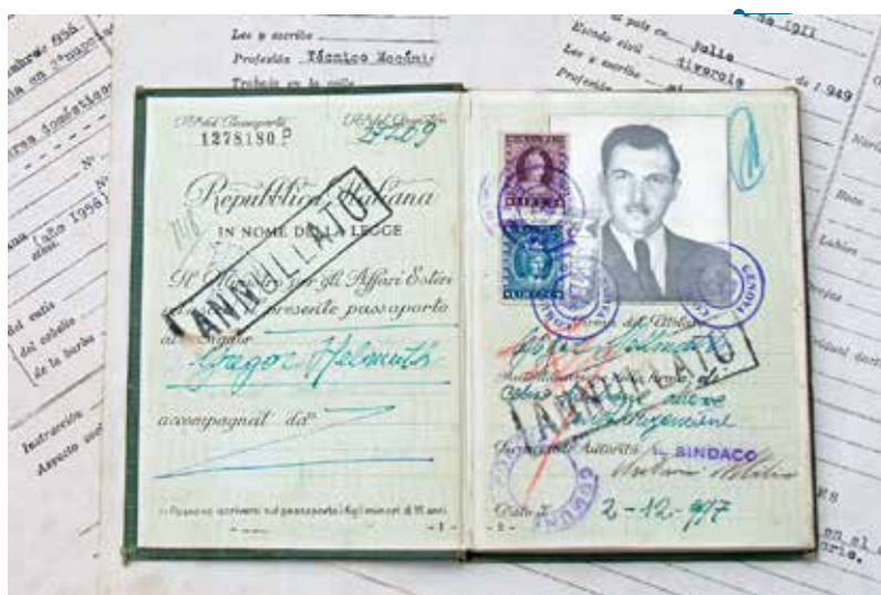
Mengele olasz útlevele

Az az érdekes, hogy ettől rögtön elszégyelli magát az olvasó, mintha máris a náci cinkosa lenne attól, hogy nem szimpatizál a vádat képviselő minden szereplővel. Holott a regény egy pillanatig sem mentegeti