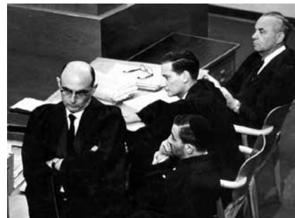
Az Eichmann-per ügyésze, Gideon Hausner, 1961

Ezekhez az országokhoz kötődtem leginkább, és ezeket soha nem fogom elfelejteni. Üdvözlöm a feleségemet, a családomat és a barátaimat. Készen állok. Hamarosán találko-