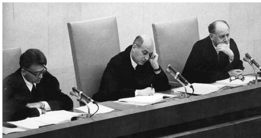
Az Eichmann-per bírái

A pert hatalmas érdeklődés kísérte, az izraeli televízió élőben közve-