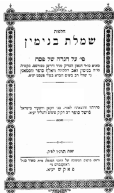
Halifot Szimlat Binjamin című könyv címlapja

évszázada fejt ki gyümölcsöző működését, melynek eredményeképpen újra naponta van mind imád-