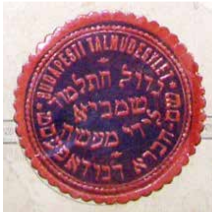
A Budapesti Talmud Egylet viaszpecsélyenymata

„Ezen háznak jövedelme elsősorban talmudisták hathatós segélyezésére fordítandó, hogy az Egylet magasztos célját valósíthassa s csak