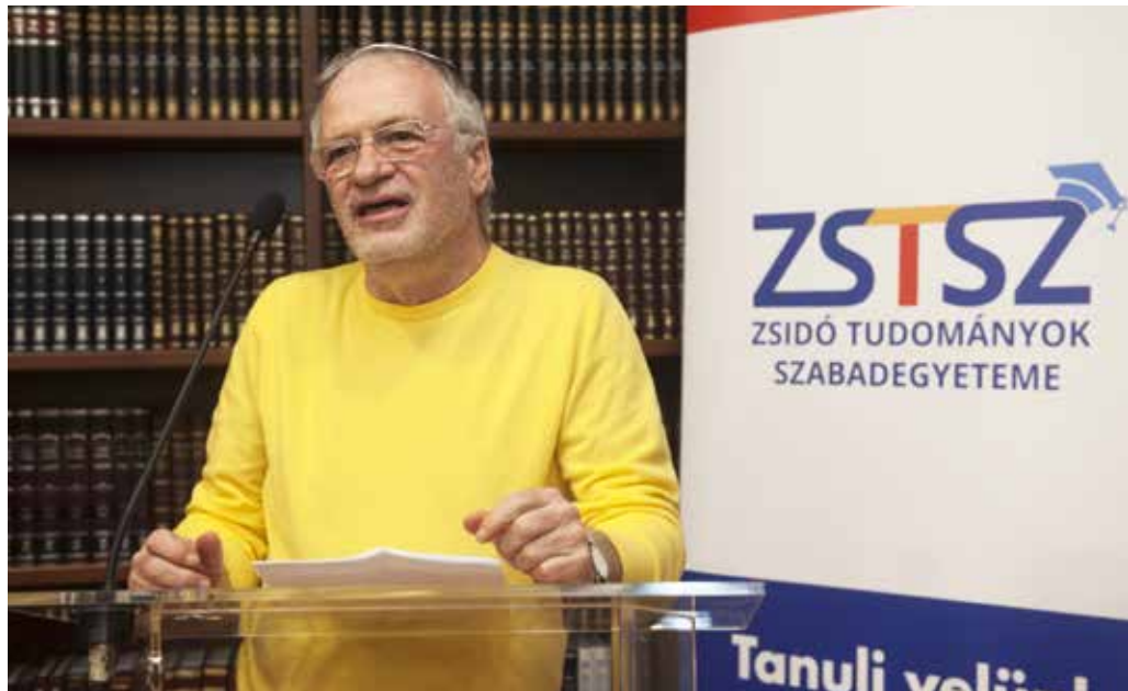
A szerző a ZsTSZ konferenciáján

Ebben partnerek azok az értelmiségiek és társadalmi aktivisták is, akik a Közel-Kelet egyetlen emberi jogokkal bíró államát jogtiprónak látatják; a minden állampolgárának