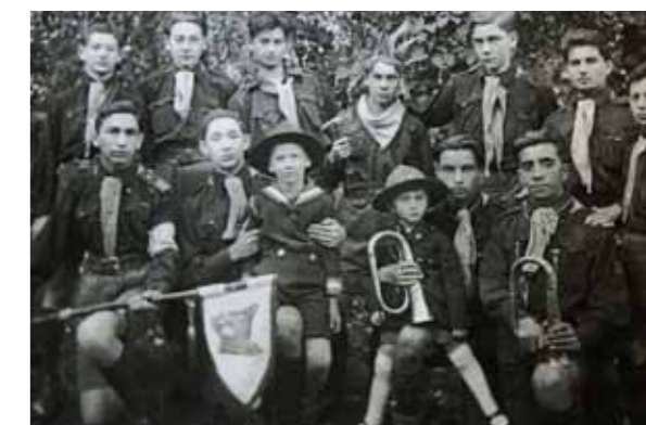
Farkas őr (1924)

1941 novemberétől a BM betiltotta az amúgy is már feloszlatott zsidó cserkészcsapatok minden működését. Megható olvasni búcsúparancsukat: „Szolgálat: A cserkészmunka újabb megindulásáig a