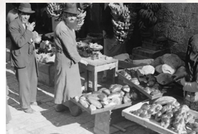
Kenyérárus Meá Seárim piacon, 1935

Izraelben mindenfelé megtalálható az eredetileg az Ottomán Bi-