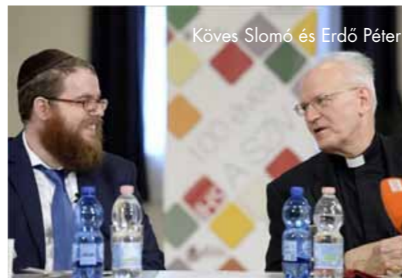
Köves Slomó és Erdő Péter

A második fő kérdés a migránsokra vonatkozott. Erdő Péter a felebará-