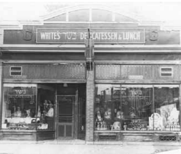
Kóser üzlet New Yorkban

A pastramit román és orosz zsidó bevándorlók honosították meg New Yorkban a XIX. század második felében. Eredetileg libamellből készült, Amerikában azonban ára miatt a marhahúst részesítették előnyben. A húst alaposan befűszereztek, megfűstölték, majd meggőzölték. Így biztosították, hogy sokáig ehető maradjon. A pastramis szendvicsek a legenda szerint olyan sikeresek voltak az amerikai fő-