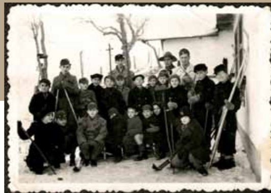
A Wesselényi utcai iskola Ezüst farkas cserkészcsapata

A világháború utáni forradalmi idők viharai megtépázták a magyar cserkészetet, és az azt követő zsidóellenes megtorlások során az újjászerveződő cserkészsövetségbe lehetőleg nem vették be a zsidó csapatokat. El is érték, hogy – az egyetemek, főiskolák mintájára – itt is bizonyos „numerus clausus” érvényesült. Lehetőleg vallásilag homogén, csak zsidó vagy csak keresztény csapatokat szerveztek, a keresztény