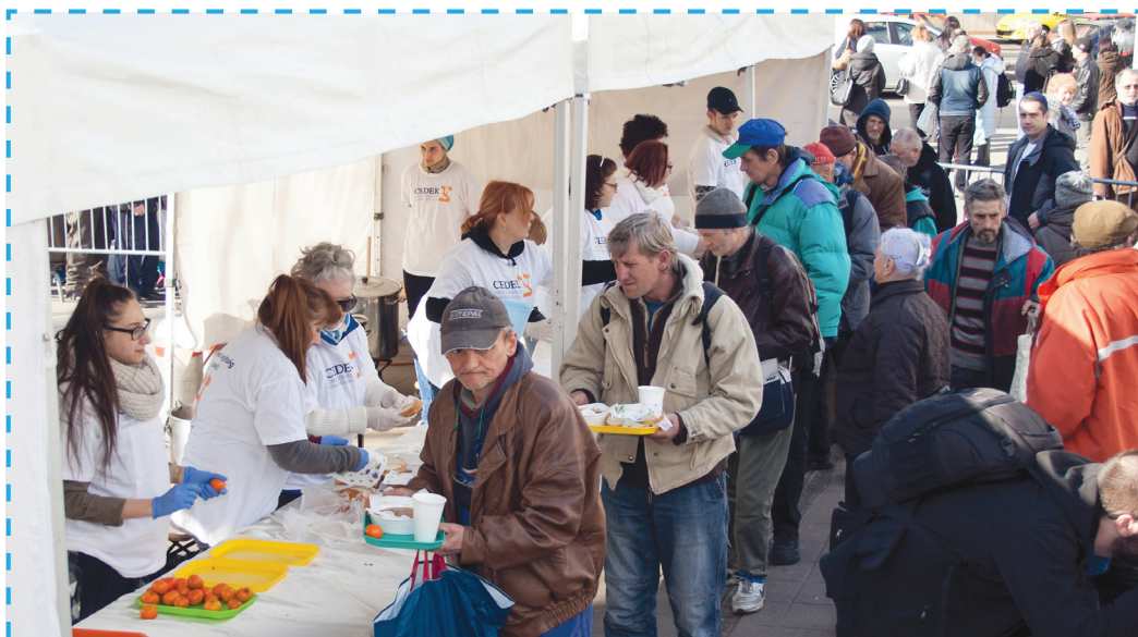
A CEDEK Szeretetszolgálat ételt oszt a rászorulóknak