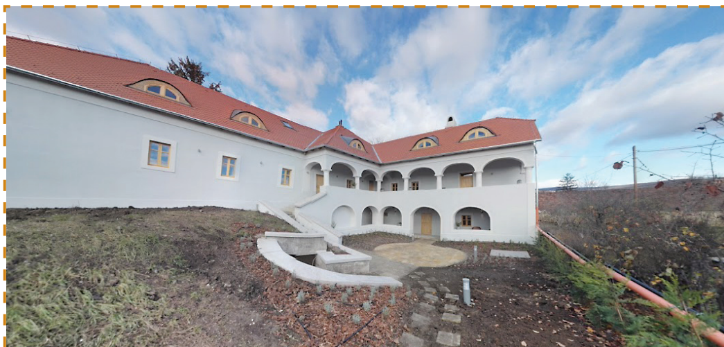
Mádi rabbiház – Egy új fejezet kezdete

2016-17-ben is folytatódik az EMIH hittanoktatása, melynek segítségével az állami iskolákba járó gyerekek is megismerkedhetnek vallási gyökereikkel. Az informális, élményalapú oktatási programmal játszva tanulnak a gyerekek. A szülők gyermekeik iskolájában jelezhetik, ha ebben az évben a hit- és erkölcs tanterv keretében ezt a programot szeretnék választani.