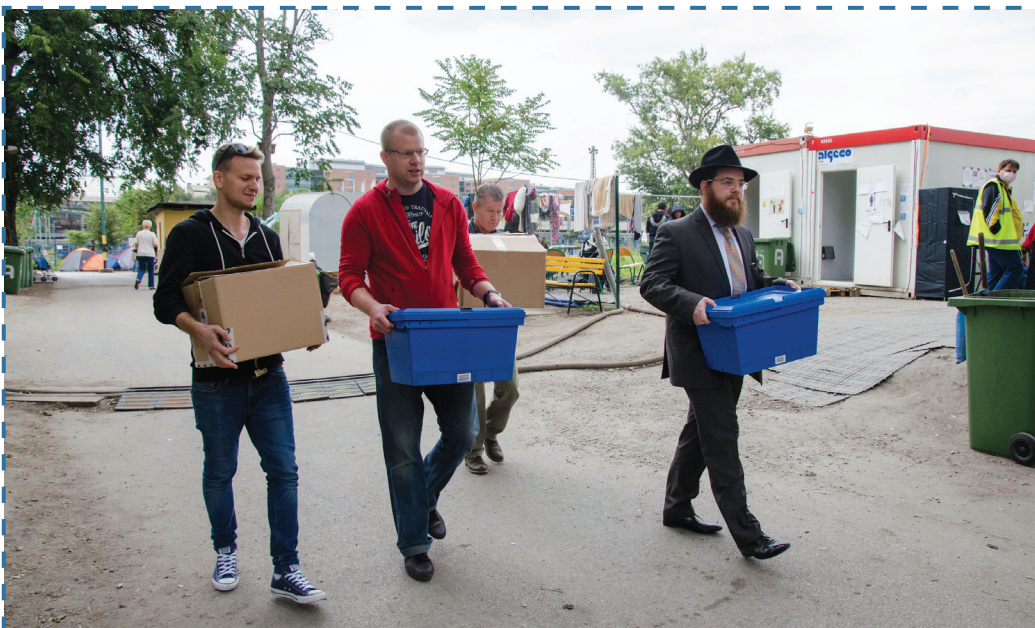
Az EMIH gyógyszeradománnyal segítette a menekülteket