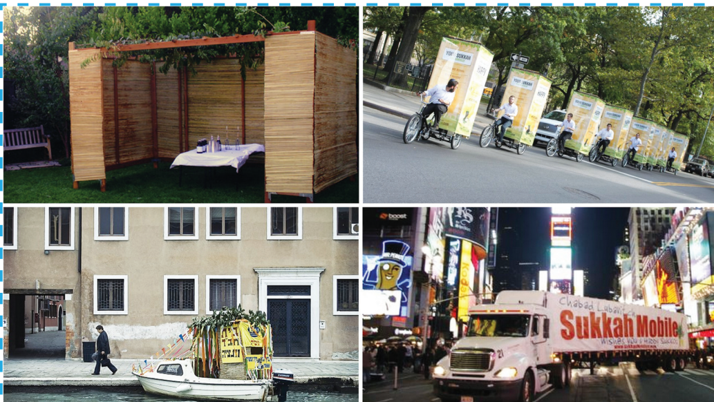
Szukkák szárazon, vízen, úton, útfélen

Október 4-én pedig ugyanitt 10-16 óráig várják az ünneplőket a fergeteges szukkoti karneválon. Gólyalábas bemutató és gokart, arcfestés és svédasztal: itt minden együtt van egy sátoros bulihoz!