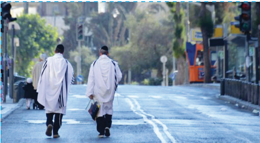
Jom Kipur Jeruzsálemben