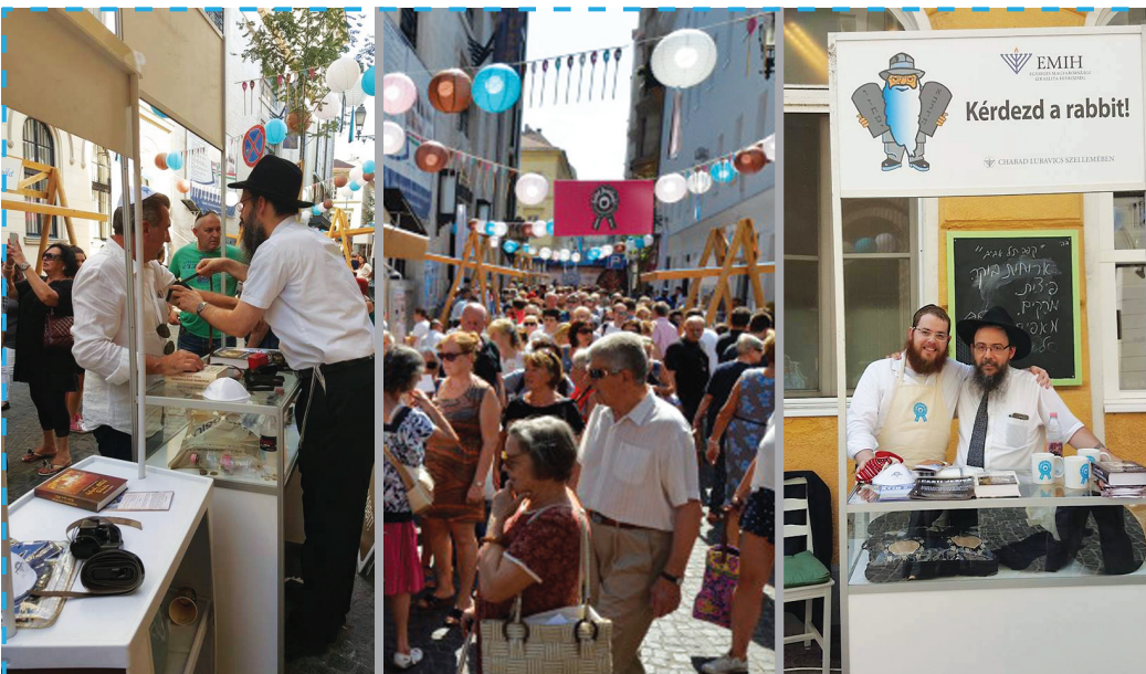
Étel testnek és léleknek az első Sóletfesztiválon.